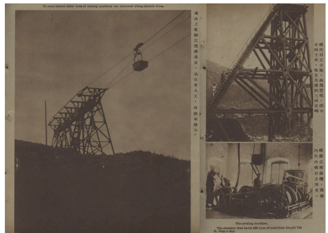
Figure 3. Yunnan adopts scientific mining