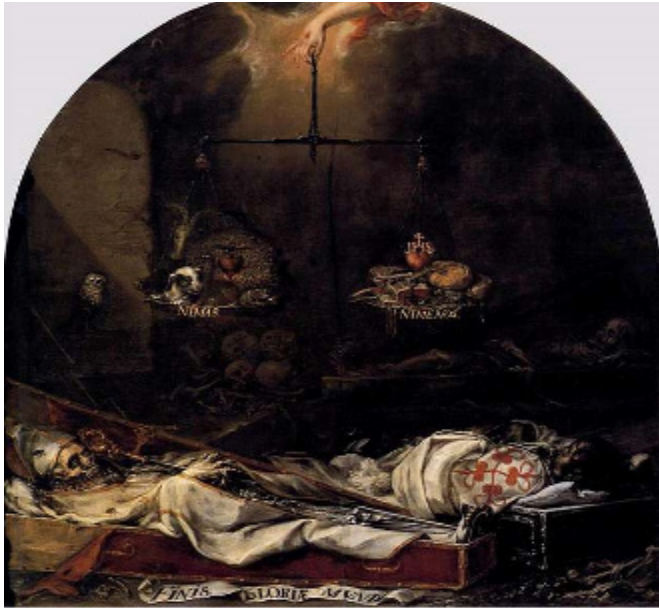
Figura 1. Juan de Valdés Leal (1670-1672). Finis gloria mundi

Quines runes ens esperen. Tres filosofies de la ruïna a Walter Benjamin