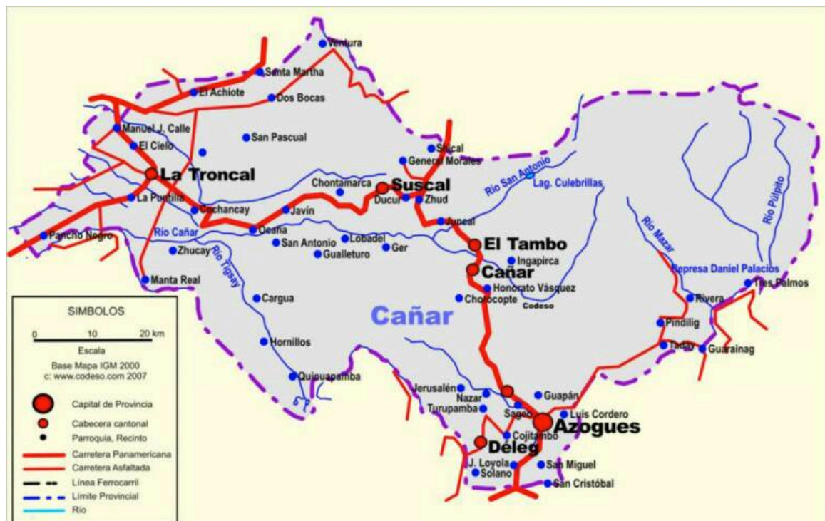
Figura 2. Mapa de Cañar (página web del Gobierno Provincial de Cañar) 2

P1 y P2 son mujeres ecuatorianas de Azogues, Ecuador con educación universitaria. El mapa en Figura 2 demuestra la zona de donde vienen los informantes de este estudio.