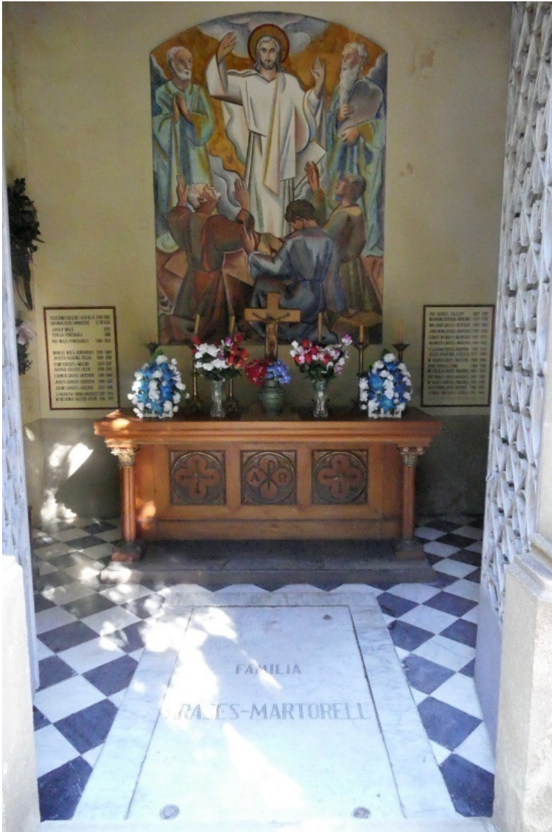
El panteó dels Milà en l'actualitat