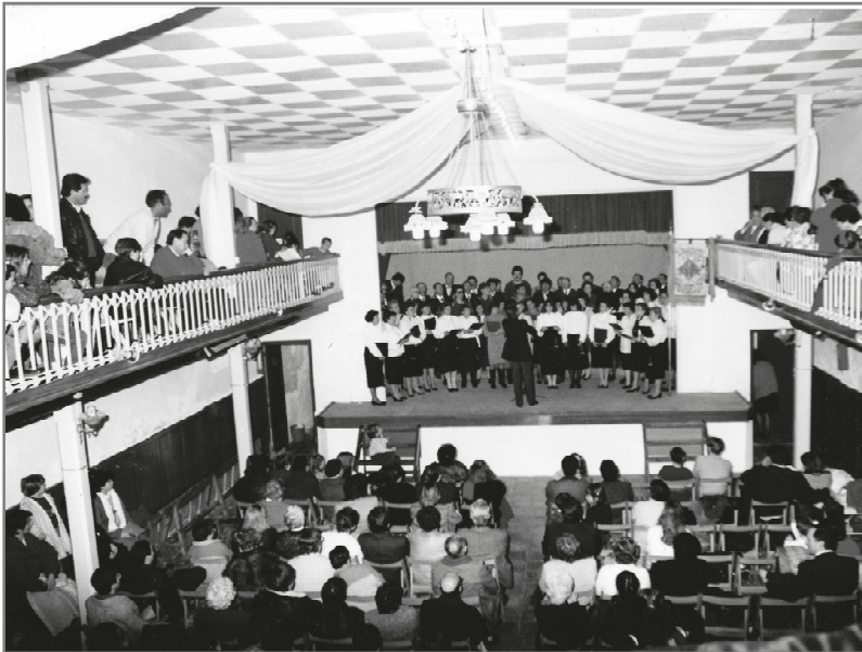
L'interior de L'Aliança en una imatge de 1988

El seu enterrament fou molt solemne, amb música inclosa. Pere Escardó va ser elegit alcalde de Cubelles el dia 1 de gener de 1914 i abans d'acabar el mandat presentà la dimissió, va ser el 15 de juny de 1915 i la motivaren els deutes que arrossegava l'Ajuntament d'abans que ell accedís a l'alcaldia. Malgrat reunir-se fins i tot amb el president de la Mancomunitat de Catalunya, Enric Prat de la Riba, no va veure una solució fàcil als problemes econò-