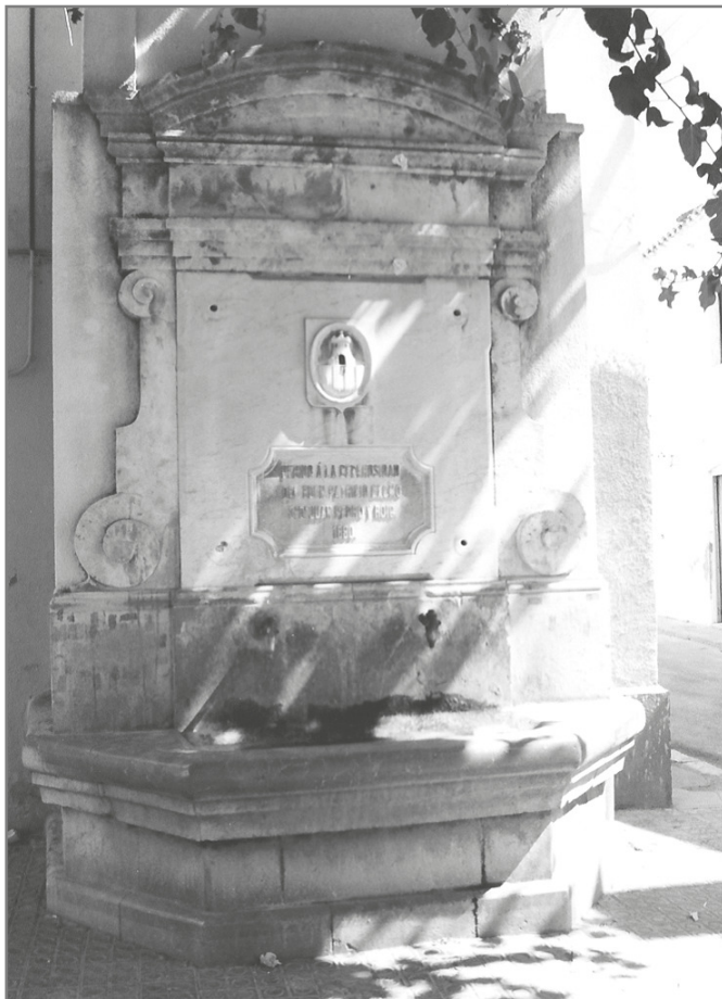
La font del carrer Major

solucionat per a Cubelles el problema de l'escassetat d'aigua i la font de malalties que suposaven els pous d'on fins llavors s'anava extraient.