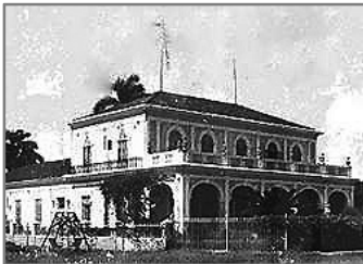
La casa-vivenda de l'ingenio Conchita

Aquest ingeni estava a Puerto Rico Libre, poblat del municipi d'Unión de Reyes, a la província de Matanzas. A partir de 1960, arran de la Ley de Nacionalización de los Centrales Azucareros , es va canviar el nom de Conchita pel de Puerto Rico Libre. L'any 2002 va quedar desactivat. De la importància que va tenir a l'època que tractem hem