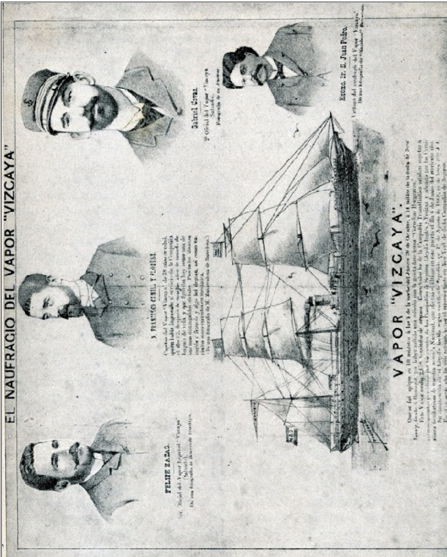
El diari Gil Blas , de l'Havana, dedicà una pàgina sencera al naufragi del Vizcaya , el 5 de novembre de 1890.