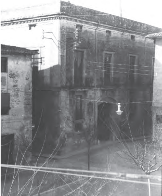
Col·legi Sant Ramon de Vilafranca