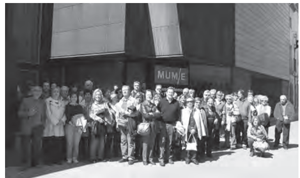
Participansts en la visita al Museu de l'Exili, a la Jonquera.