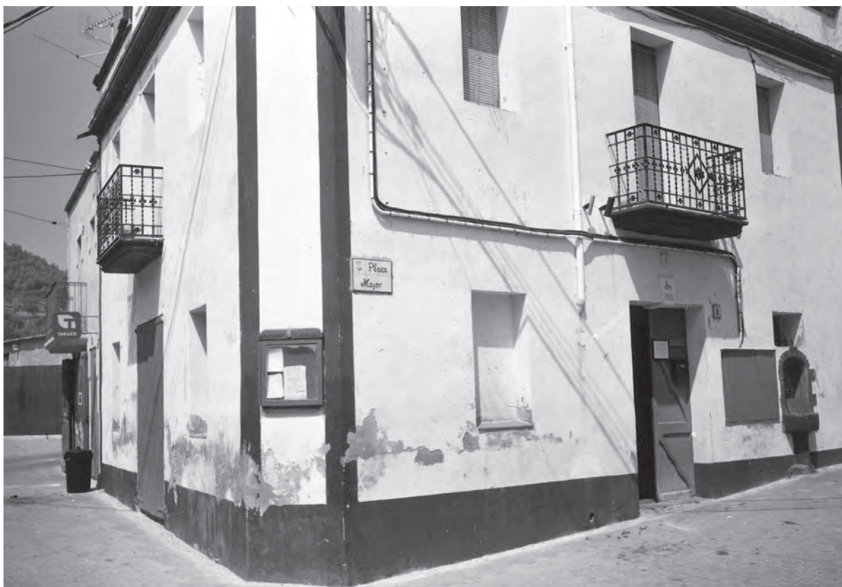
Primer Ajuntament de postguerra (22/1/1939). Observi's el segell municipal amb les quatre barres.