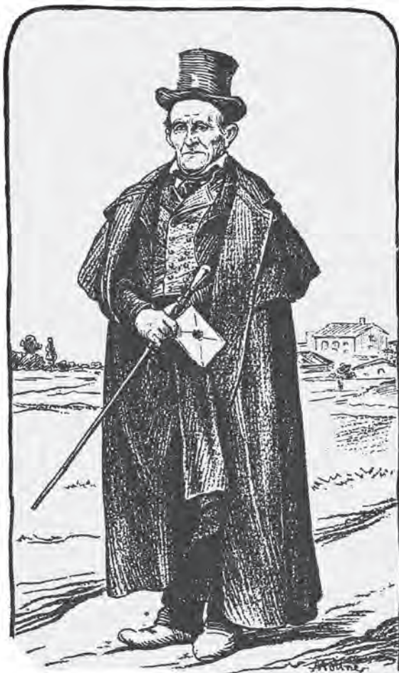
Un alcalde rural.

18/2/1780 (ACA) - L'abat regala una vara a cada un dels batlles de la baronia.