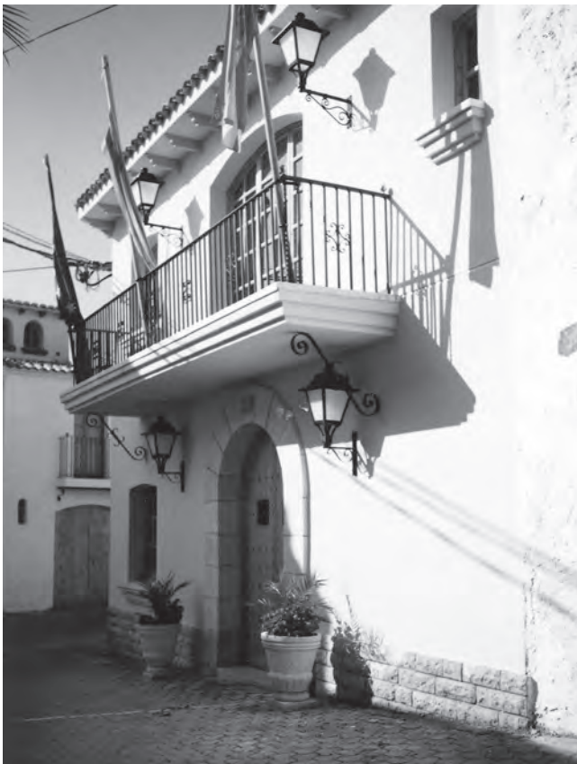
Casa de la vila a partir de 1993.