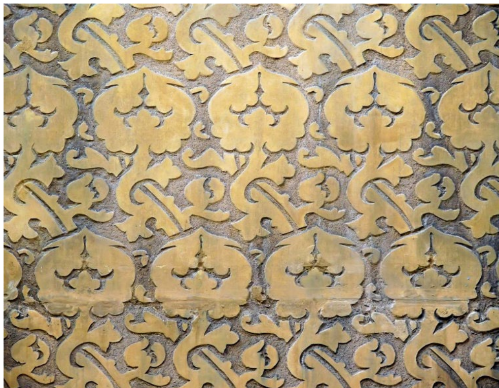
Detall de l'esgrafiat de la Casa Carlos de Llanza i de Carballo (1897-1898, reforma), a Barcelona.