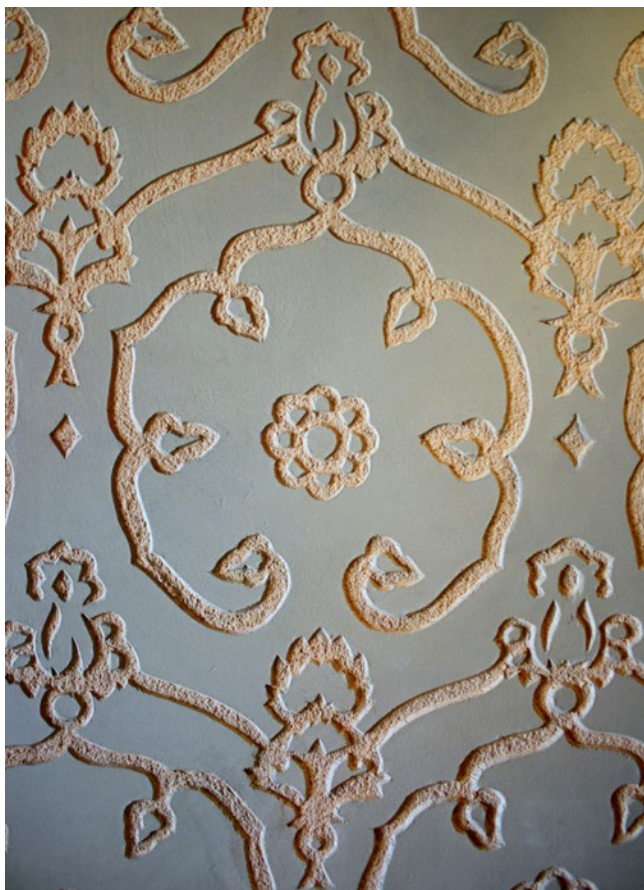
Detall de l'esgrafiats del vestíbul d'entrada de la Casa Garí (1899-1900), a Argentona.