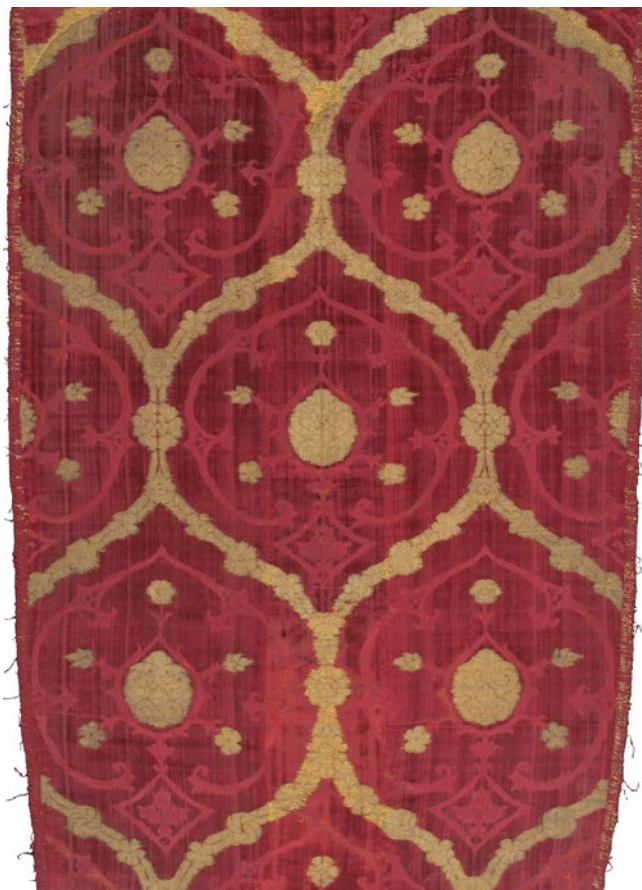
Vellut carmesí llavorat en fil d'or d'origen otomà (finals del segle XV).