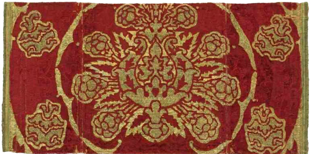
▼ Vellut amb fil d'or (c. 1475-1525)