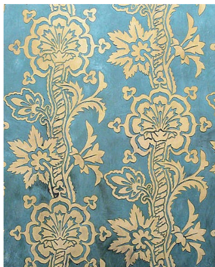
Detall esgrafiats del vestíbul de la Casa Pía Batlló (1892-1896), a Barcelona.

Pel que fa als esgrafiats en l'obra Domènech, tenim dos exemples que provenen de solucions decoratives tèxtils força semblants entre elles: els esgrafiats del vestíbul de la Casa Navàs (1901-1907), a Reus, i dels estucats al foc de la sala d'estar del pis principal de la Casa Lleó Morera (1902-1906), a Barcelona. Ambdues composicions es distribueixen a mode de tapís amb formes romboïdals fisonades, i amb poms florals a l'interior d'aquestes –l'esgrafiats de Reus és més complex, ja que inclou corol·les i altres elements vegetals– 15 . La presa d'aquests models poden provenir de nombrosos teixits baix-medievals