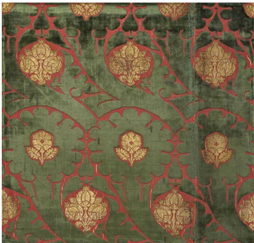
Vellut de seda italià (c. 1425-1450)