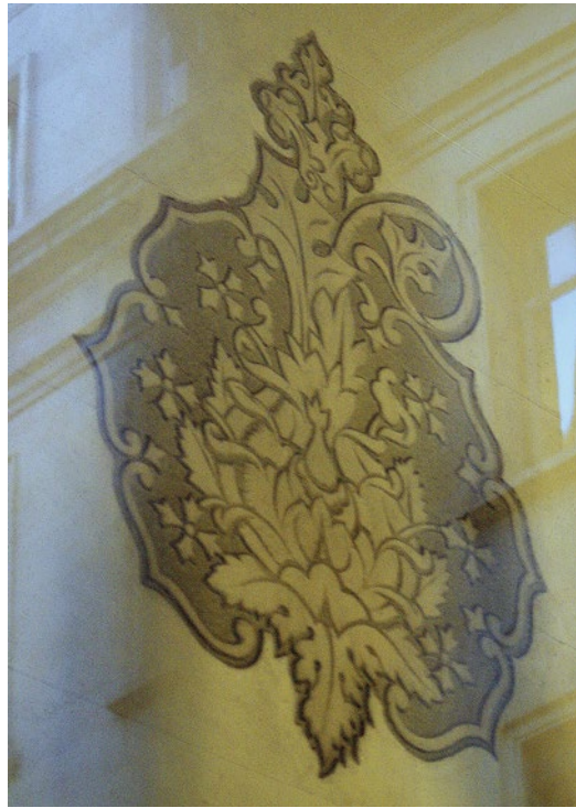
◀ Floró esgrafiats del vestíbul d'entrada de Can Camps (1898-1898, reforma), a Barcelona.