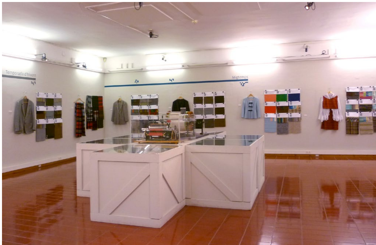
▲ Vista de la segona sala de l'exposició Diccionari dels teixits fets a Sabadell . Foto Roser Enrich/MHS, juny 2015.

L'exposició es cloïa amb l'audiovisual Del be al teixit , que mostra tot el procés tèxtil llaner. 4