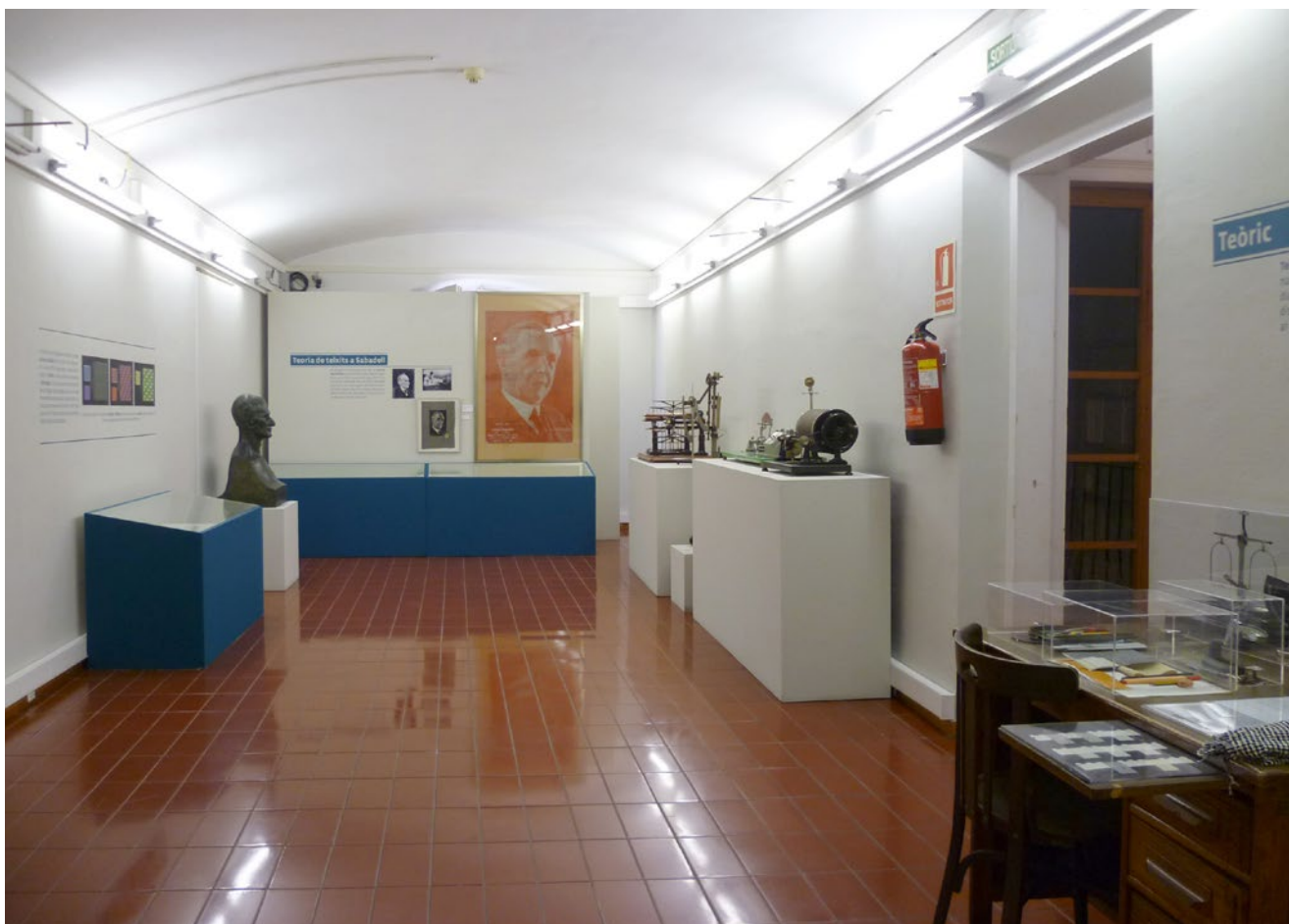
Vista de la primera sala de l'exposició Diccionari dels teixits fets a Sabadell. Vegeu més.