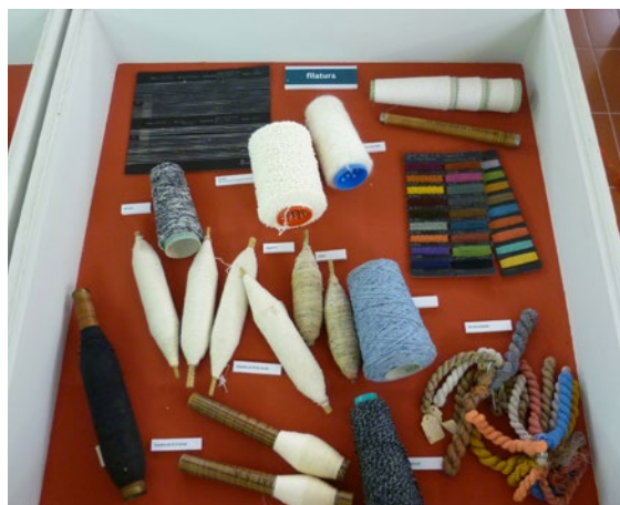
► Detall d'una de les vitrines de l'exposició Diccionari dels teixits fets a Sabadell . Foto Roser Enrich/MHS, juny 2015.