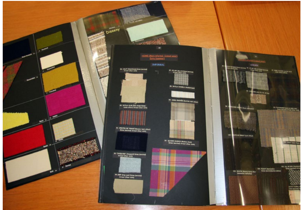
Volums del Diccionari oberts. Abril 2016.

L'any 2009 es començà la catalogació dels mostraris de tintoreria, afegint alguns camps específics a la fitxa. La catalogació s'ha centrat bàsicament en els mostraris de l'empresa Estruch tèxtil.