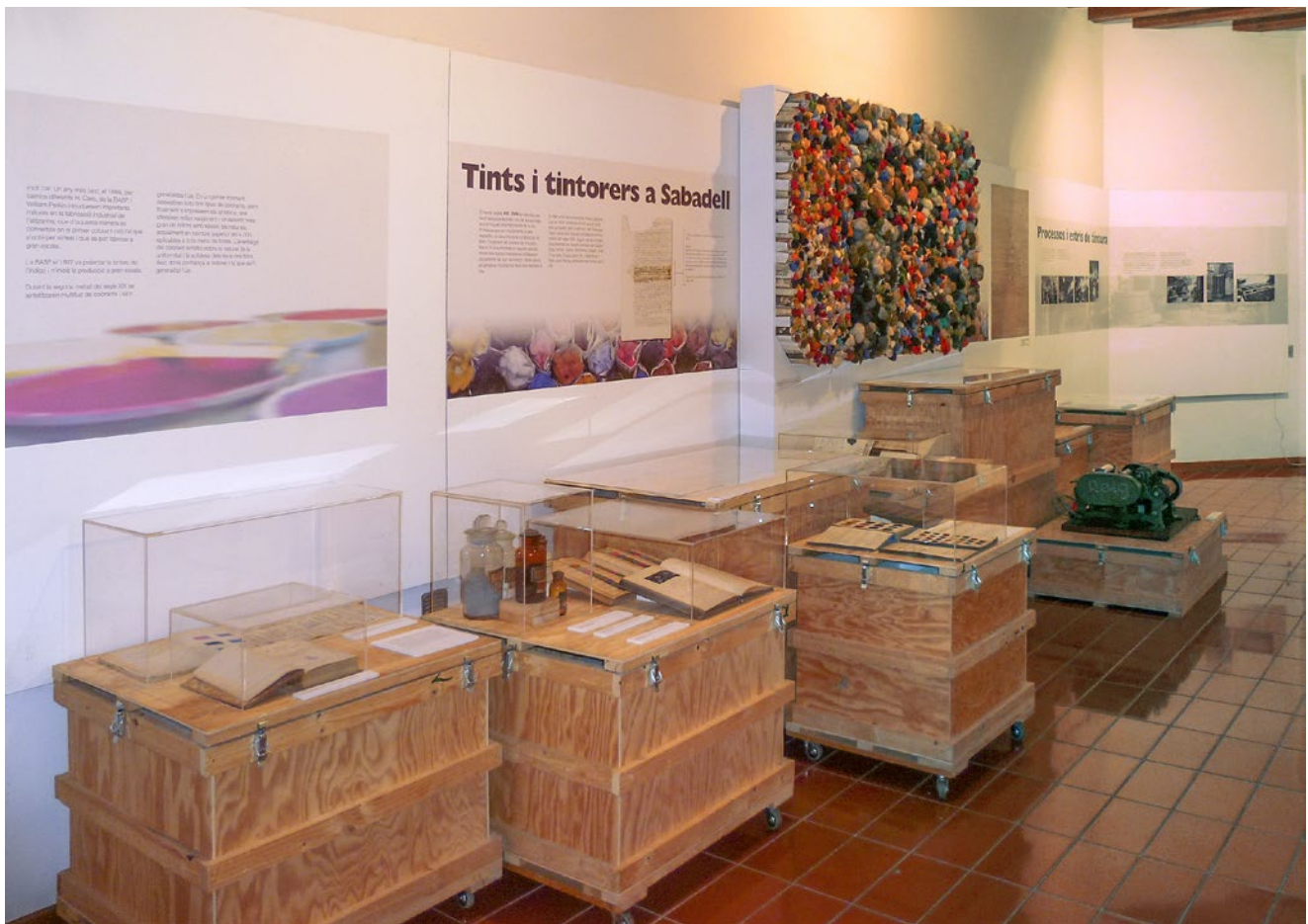
Vista de l'exposició Tints i colorants a Sabadell. Una història que ve de lluny. Febrer 2014.