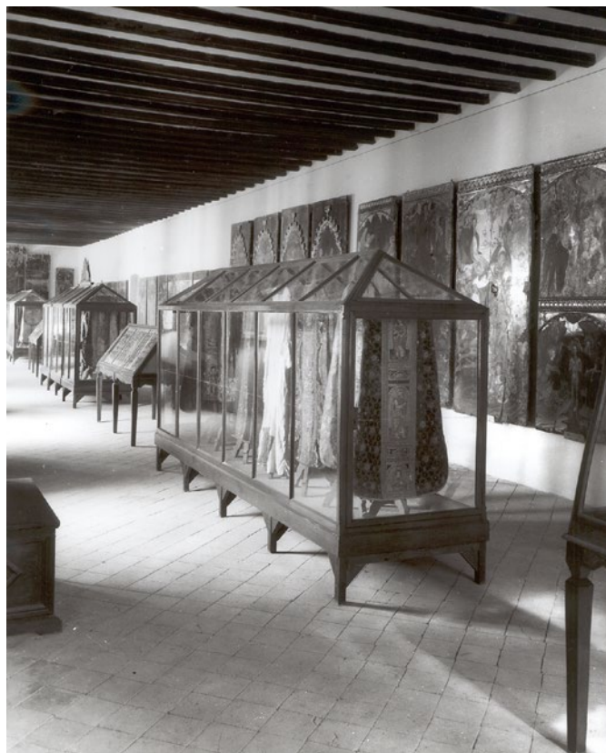
Instal·lació d'indumentària litúrgica a l'antic edifici del Museu Episcopal de Vic, any 1934.

10 Asociación Artístico-Arqueológica Barcelonesa. Exposición Universal de Barcelona. Álbum de la sección de Ropas y Bordados . Barcelona, 1888.