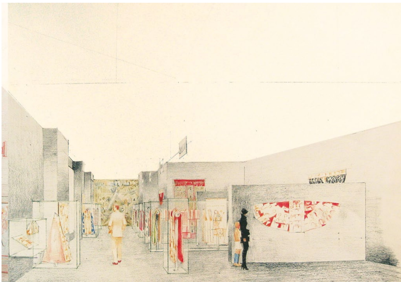
Dibuix de Federico Correa del projecte de la sala de teixit i indumentària. Federico Correa i Alfonso Milà van ser els arquitectes del nou edifici del MEV, inaugurat l'any 2002.

Avui, el Museu Episcopal de Vic disposa d'uns 2000 teixits que integren una col·lecció tèxtil d'una gran identitat i que és reconeguda internacionalment per la varietat i notorietat dels seus exemplars. La col·lecció de teixit i indumentària és en sí mateixa, un museu dins d'un museu, per això, i per garantir-ne la bona conservació, es va crear un espai expositiu amb una estètica pròpia, diferent de la resta de sales del museu. Aquesta, està composta per una banda, d'una excel·lent representació de teixits històrics de gran qualitat artística i per l'altra d'una excepcional col·lecció d'indumentària litúrgica que il·lustra, a la perfecció, la història d'aquests tipus d'ornaments religiosos.