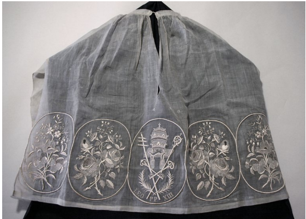
Roquet per al papa Lleó XIII, 1887, teixit amb fil de pinya i brodat amb cotó. Sagristia Apostòlica del Vaticà © Txeni Gil. Veure detall .

Els comerciants espanyols no van trigar a incloure aquell producte entre les exòtiques i luxoses mercaderies de la ruta nàutica dels galions de Manila, que des de finals del segle XVI cobria pel Pacífic el trajecte entre les Filipines i Sevilla. Així com en un primer moment els mantons van ser emprats com a cobertors o tapissos, amb el temps van acabar esdevenint un complement més de la indumentària femenina espanyola. Qui primer va lluir-los van ser les dones amb més poder adquisitiu, tot i que, a partir del darrer terç del XIX, el seu ús es va generalitzar a totes les classes socials –especialment en el període de la regència de Maria Cristina (1833-1840)–, i fou incorporat, fins i tot, als vestits regionals.