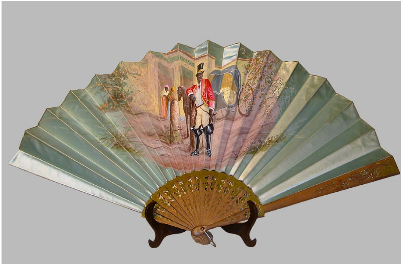
Ventall amb escena de temàtica colonial, tela de ras pintada, fusta de cirerer, llautó, últim quart s. XIX, Museu d'Arenys de Mar, núm. reg. 3349.

Dins l'entramat comercial i econòmic generat per la indústria tèxtil, els comerços, botigues o grans magatzems també hi tenen la seva importància. Els dietaris de viatge, les cròniques, la premsa i la literatura deixen testimoni de la intensa vida comercial de Cuba, amb l'esment d'establiments dedicats a la venda de roba –molts d'ells regentats per catalans– veritablement opulents per la gran quantitat de mercaderies que exhibien. Cal dir, també, que amb els diners indians també s'obriren importants botigues de teixits a la metròpolis. És el cas dels dos madrilenys enriquits a Cuba, Pablo del Puerto i Eduardo Conde Giménez, que van decidir fundar a Barcelona una botiga de camises i roba blanca que el 1881 esdevindria els Almacenes El Siglo , uns dels més populars de Barcelona. Mig segle després, quadrant el cercle, Pepín Fernández i Ramón Areces, també enriquits a les Antilles, fundaven respectivament a Madrid Galerías Preciados i El Corte Inglés , dos referents en la indústria i comercialització del tèxtil espanyol.