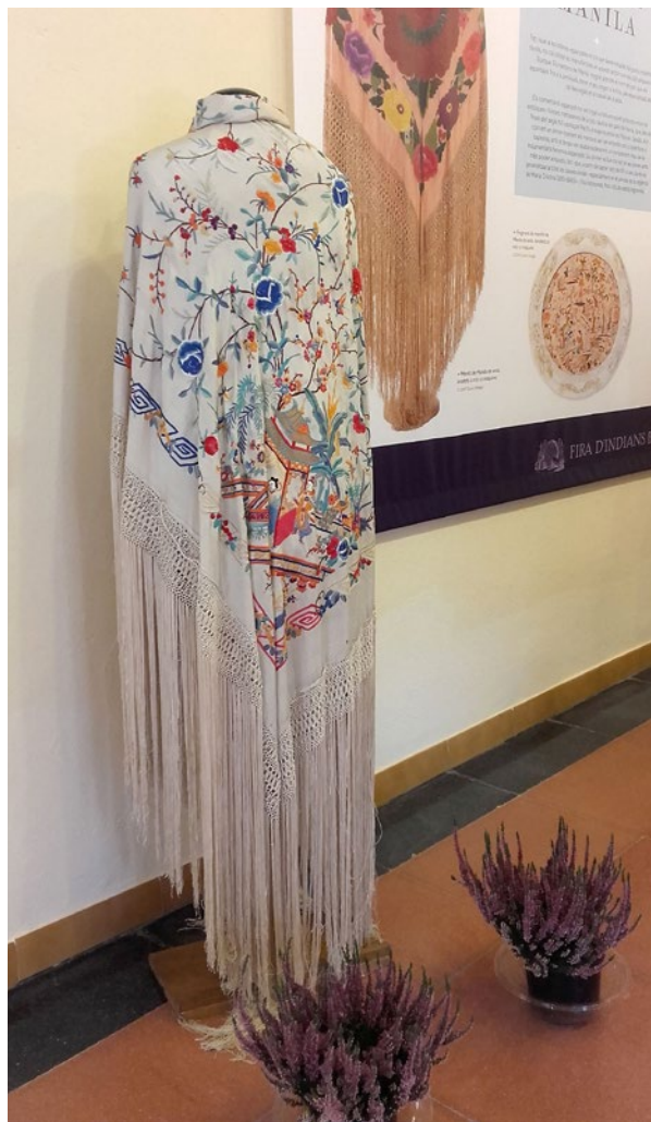
Mantó de Manila, seda natural brodada, principis s. XX, Col·lecció Viñas, L'Arca.

D'entre la vasta i variada producció pictòrica de Casas, destaquen, per la bellesa i sensualitat de formes i colors, els retrats de les conegudes com a chulas i manolas . Moltes d'elles apareixen guarnides amb un complement tèxtil de seda que, pel delicat tacte, la rica combinació cromàtica dels brodats i l'exotisme que generava, va acabar arrelant molt fort a la societat espanyola: el mantó de Manila. Tot i que a les colònies espanyoles no s'hi van desenvolupar mai grans indústries tèxtils, no cal oblidar les manufactures tèxtils que des d'allí arribaren a Europa. Els mantons de Manila, malgrat prendre el nom del port que els exportava fins a la península, tenen el seu origen a la Xina, país especialitzat des de feia segles en el treball de la seda.