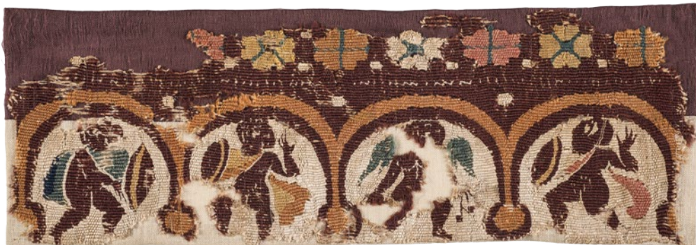
CDMT n.r.87, segles V-VI. Veure detall.

Dels teixits números de registre 87, 207, 222, 245 i 304 es va fer anàlisi de colorants pel sistema de cromatografia líquida d'alta resolució. 14 Les proves van