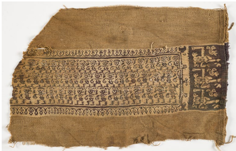
CDMT n.r.7509, segles VI-VIII. Veure detall.

Per una altra part, en el mes de febrer del 2017, el CDMT acollirà l'exposició "Antic Egipte i teixits coptes de Montserrat", de la Fundació Abadia de Montserrat, procedents de la col·lecció Roca, i la de fotografies de les excavacions d'Oxirrinc organitzada per la Societat Catalana d'Egiptologia. Una jornada de conferències complementarà ambdues exposicions.