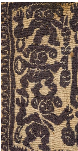
CDMT n.r.7495, segles VI-VII.