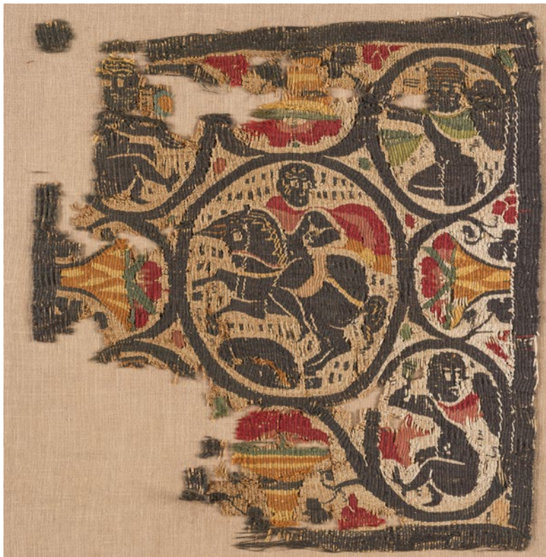
CDMT n.r.245, segles V-VI. Veure detalls.