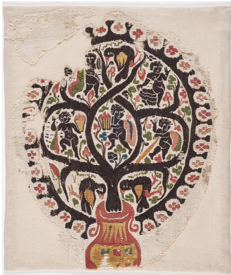
CDMT n.r.222, segles V-VI. Veure detalls.