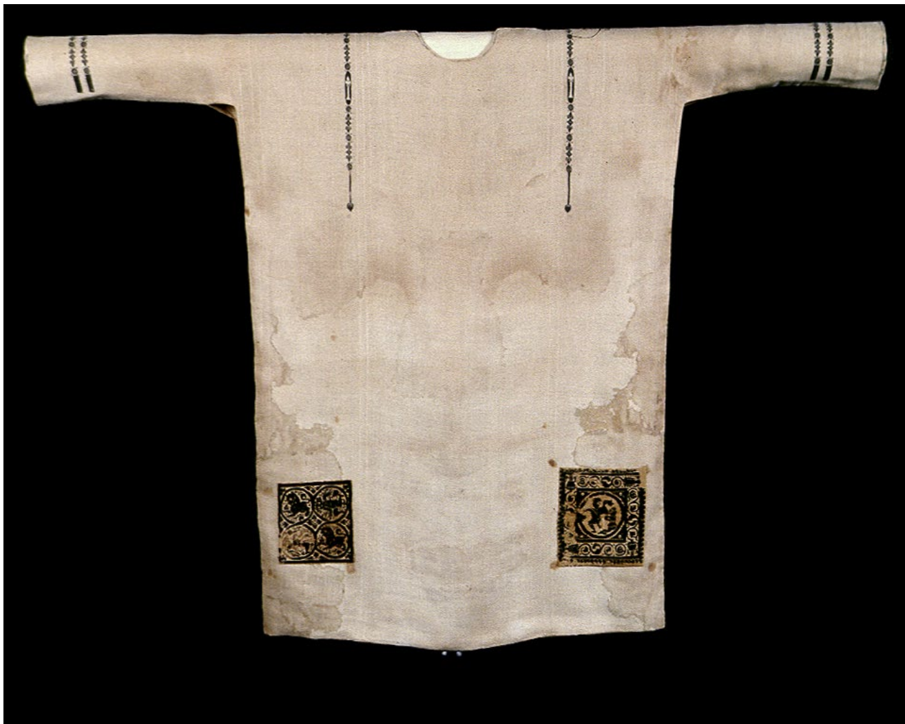
CDMT n.r.263, segles IV-VI.