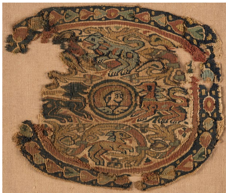
CDMT n.r.207, segles V-VII. Veure detall.