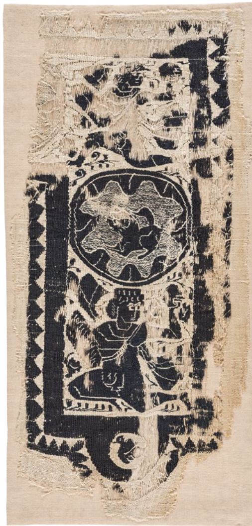
CDMT n.r.2705, segles V-VI. Veure detall.

10 Publicat a: Clothing the House. Furnishing textiles of the 1st millenium AD from Egypt and neighbouring countries . Lannoo Publishers, 2009.