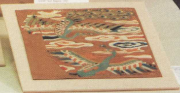
Textile panel with floral and abstract motifs.