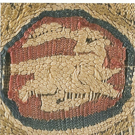
Detalle de tejidos, Egipto, s. XII. CDMT 6.463, 6.071, 6.078, 5.997, 6.077, 59, 5.841, 6.082.