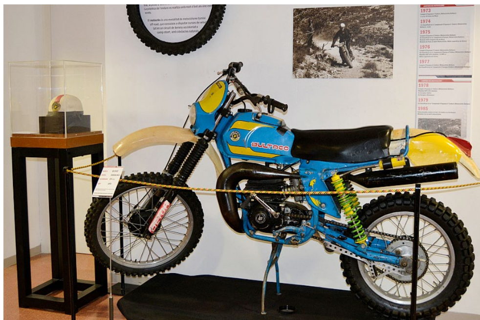
Motocicleta del campió Narcís Casas de la modalitat d'Enduro (1978). Marca Bultaco, model: Frontera MK11, 370 c.c. cedida al Museu per Narcís Casas, des del Museu de la Moto de Bassella.

Un altre factor important a aconseguir en aquest tipus de prenyes és la resistència. S'aconsegueix amb el teixit CORDURA®, patentat per DuPont l'any