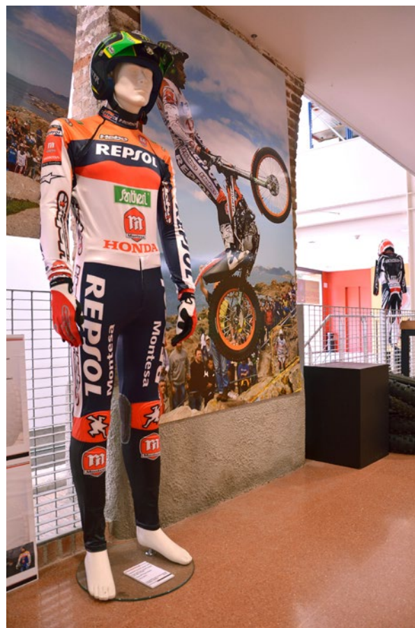
Equipació, imatges i palmarès del campió del món de trial Toni Bou, de l'equip Repsol-Montesa HRC. Vegeu més.