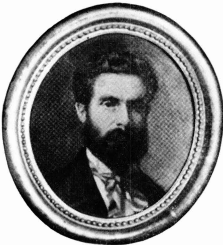
Autorretrato de Pere Borrell

Trabajando en este sentido en una investigación de ámbito más amplio, hemos tenido la ocasión de consultar los documentos personales del pintor Pere Borrell, de los cuales publicamos el inventario que él mismo hizo de sus pinturas. La publicación de este manuscrito, que comentaremos brevemente, y complementaremos