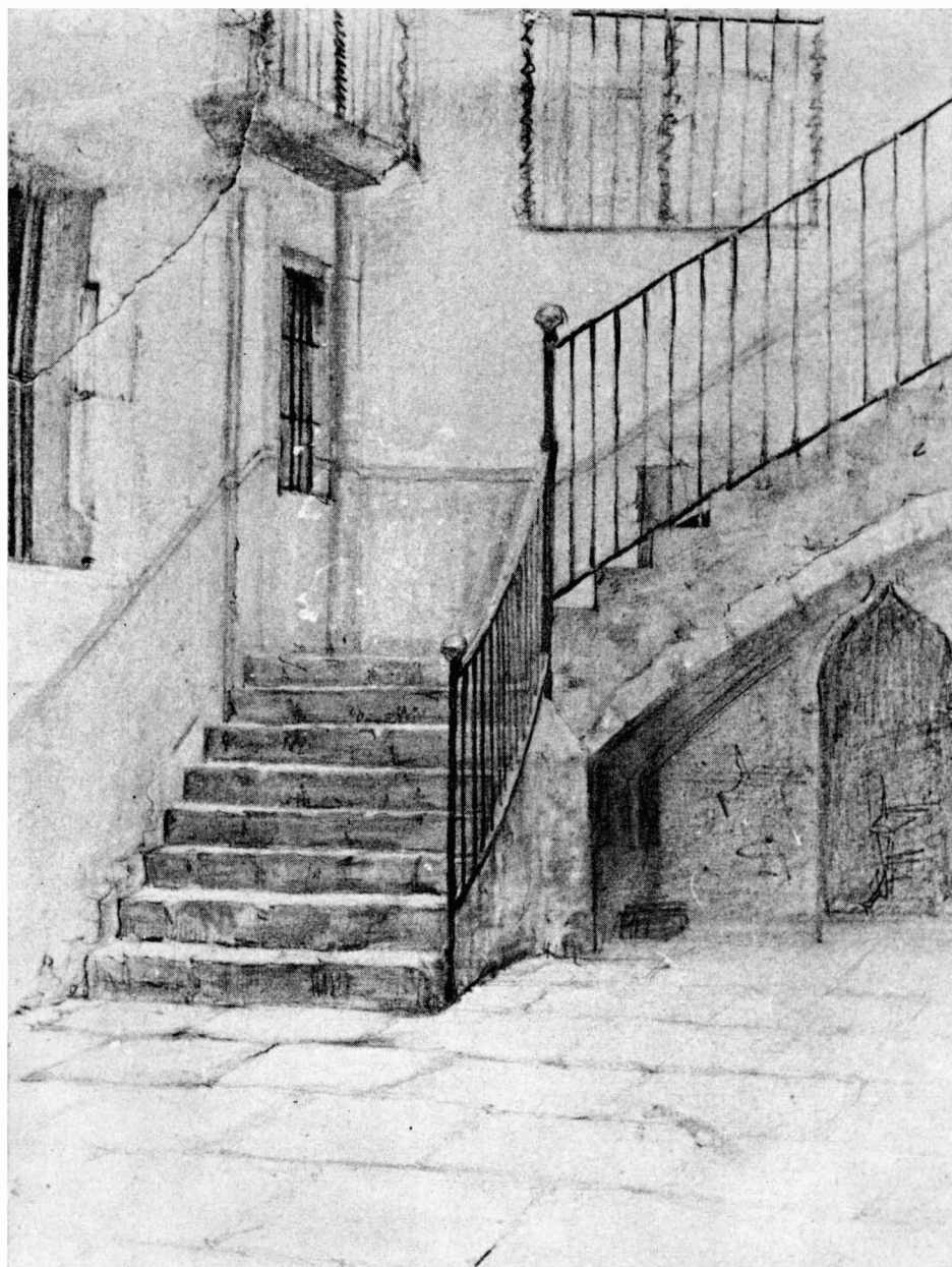
Escalera de acceso a la academia, dibujo de Pere Borrell del Caso

A partir de esta fecha, hay un descenso muy pronunciado [15], y en 1899, el año siguiente a la gran crisis finisecular, coincide también en ser el peor de todo el período para la economía de Borrell.