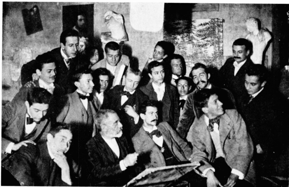
Pere Borrell rodeado de sus discípulos (~ 1895)

más distancia por el paisaje (6,36 %), la figura (5,75 %), el bodegón (4,84 por ciento) y la escena de género (3,03 %). El porcentaje correspondiente a los restantes temas corrobora la ínfima importancia de los mismos dentro de la obra del pintor.