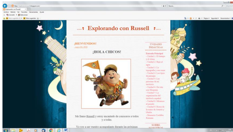
Figura 1. Captura del blog de aula.