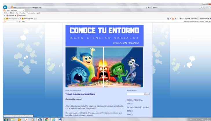
Figura 3. Captura del blog de aula.