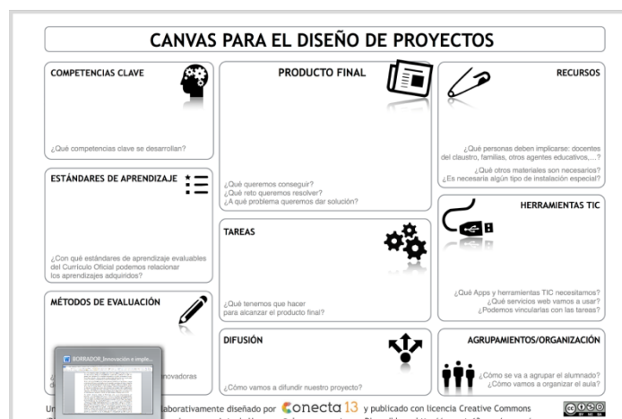
Figura 4. Herramienta para el diseño de proyectos educativos.

correspondiente a la Educación Primaria en Andalucía. Para ello se ayudaron de la herramienta de diseño CANVAS.