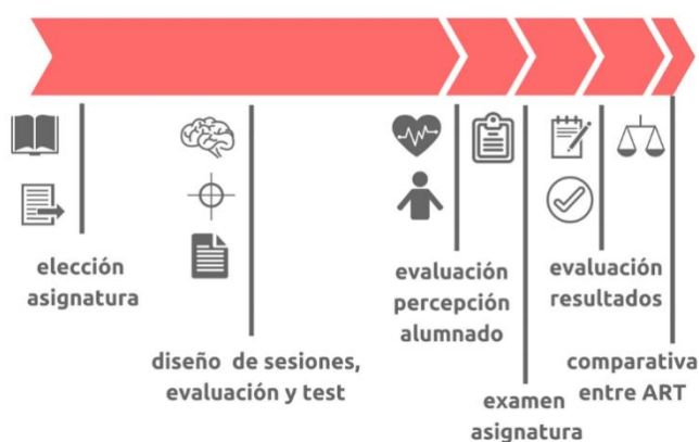
Figura 2. Proceso de trabajo.

Este estudio fue diseñado en cinco etapas, tal y como se refleja en la Figura 2.