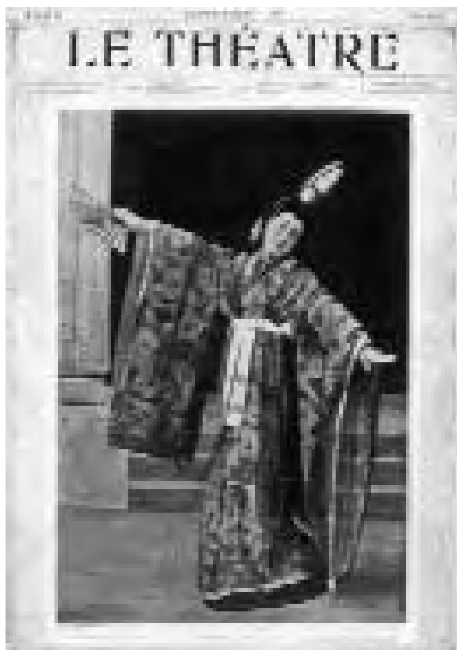
Sadayakko amb un dels vestits que duia a les representacions de l'Exposició Universal de París de 1900, a la revista Le Théâtre .

és conegut i apreciat a pràcticament tot el món–, etc. No obstant això, si el país ha aconseguit recuperar el poder de seducció que havia tingut abans del conflicte, no ha estat pas gràcies a aquesta mena d'exportacions.