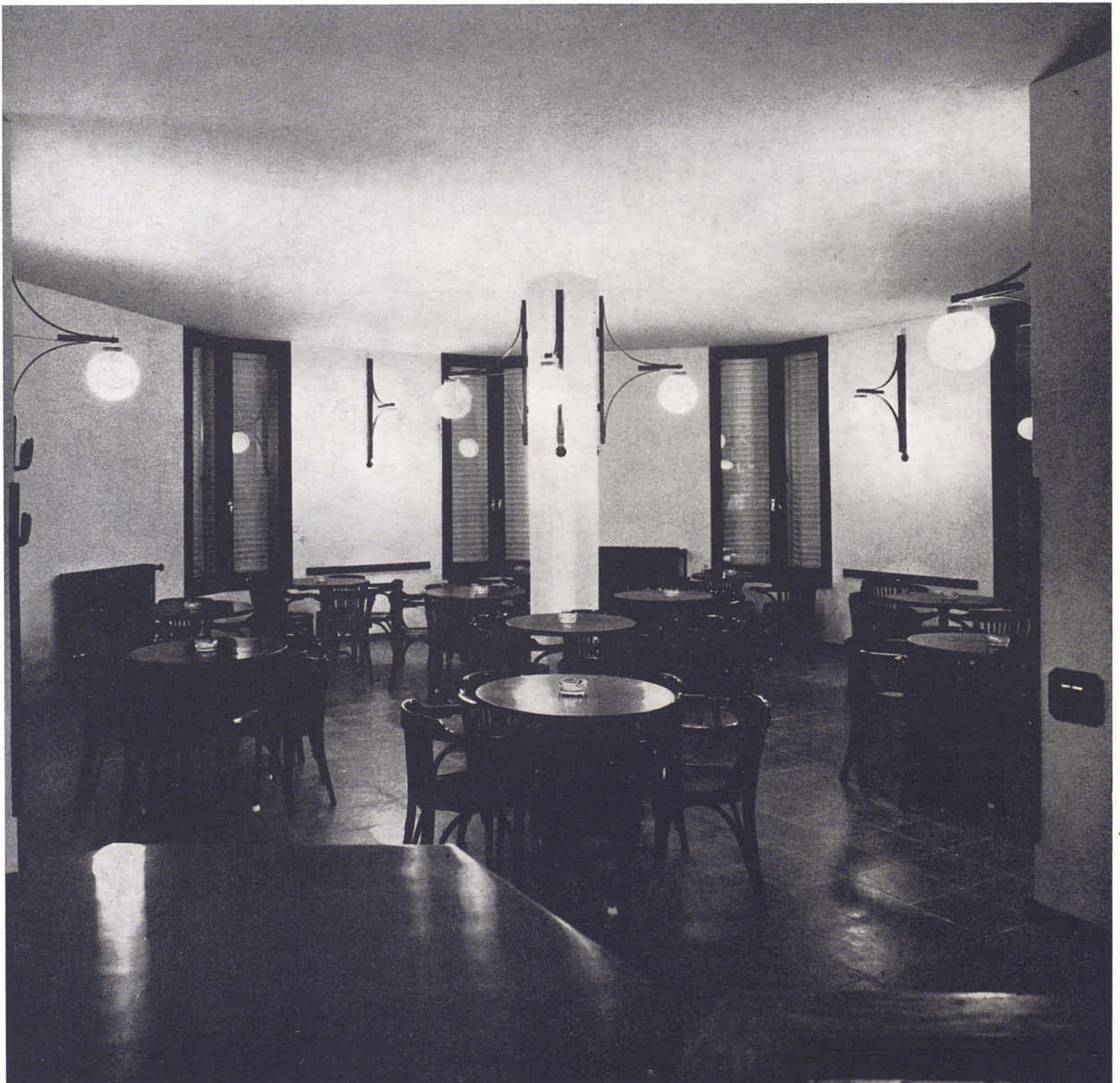
La sala de juego intenta conservar el ambiente de los antiguos cafés de pueblo. Sillas de madera curvada pintada al duco.

Fundamentalmente se pretendía que dicha construcción se adaptase a los usos tradicionales de este tipo de entidades, como puede ser la sala de juego: dominó, cartas, etcétera, y a los usos nuevos como son