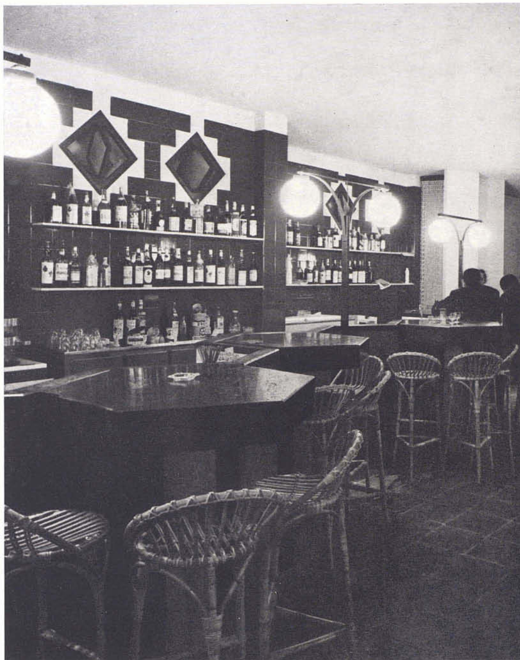
Vista de la barra del bar desde la sala de juego.

En conjunto, el local destinado sobre todo a la gente joven que no se encontraba a gusto en el «caserón» del antiguo Ateneo, constituye una réplica formal de aquél, adoptando incluso alguno de sus elementos de diseño (sillas valencianas, azulejos, etc.).