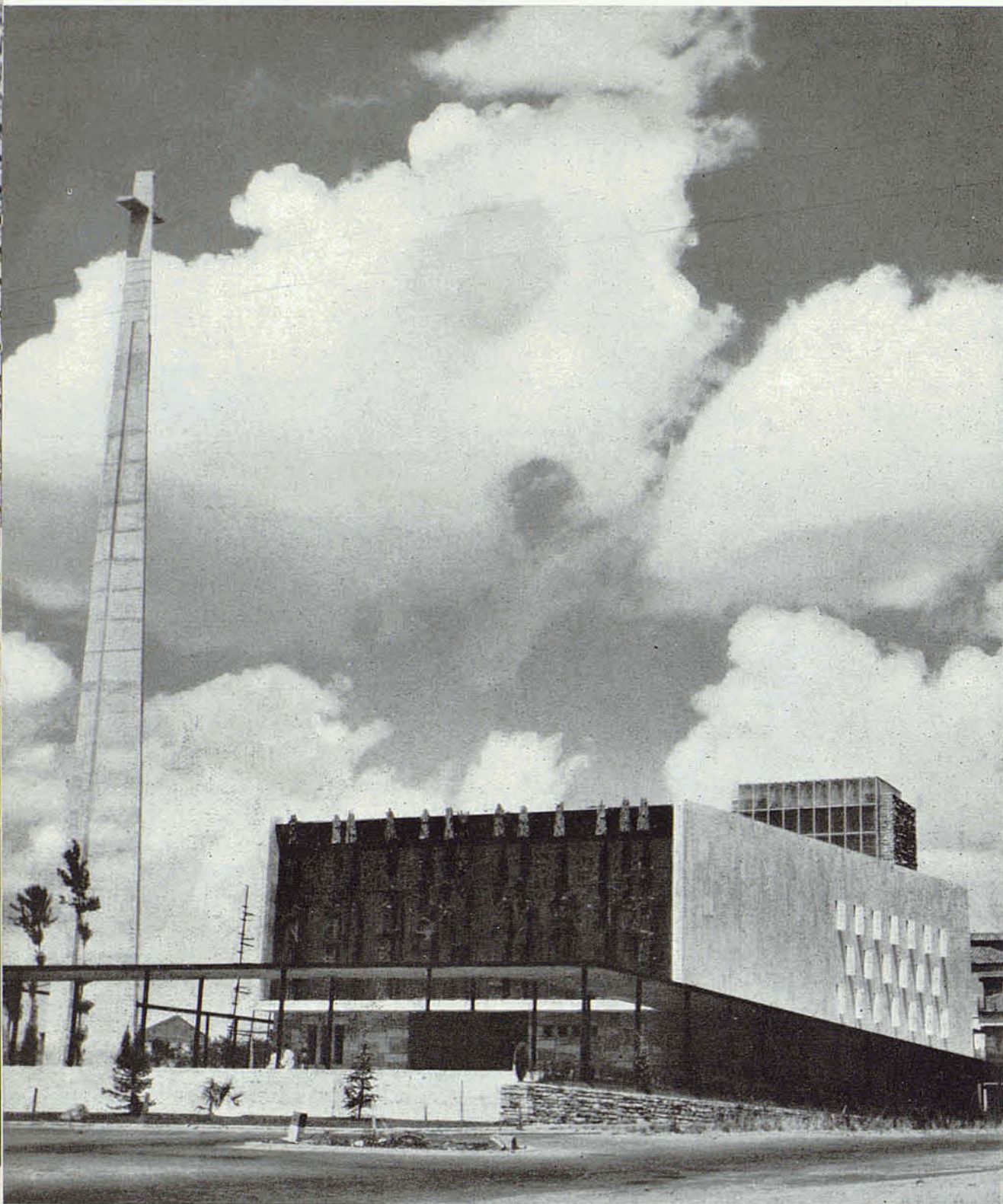
Vista de conjunto.

Unos pequeños jardines y una escalinata aíslan la edificación, separándola de la carretera. La gran explanada está sembrada de césped, cuadrículado por paseos en losas de granito y en torno a toda ella crece ya un agradable bosquecillo, que da una particular fisonomía al paisaje estepario que la rodea.