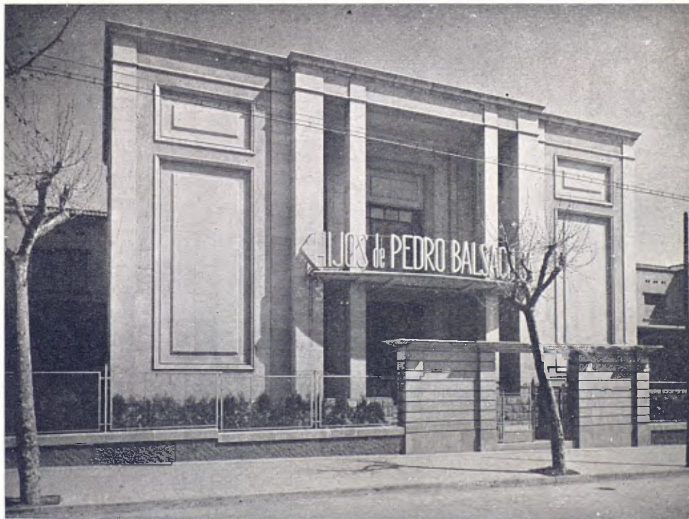
Puerta principal de la fábrica y jardín que rodea el cuerpo de edificio destinado a gerencia, oficinas y laboratorio

La estructura de la cubierta de la nave principal es del tipo de diente de sierra construida con perfiles de hierro laminado a base de jácenas verticales sustentantes ante claraboyas y cuchillos asimétricos en los tendidos de cubierta. El resto de la cons-