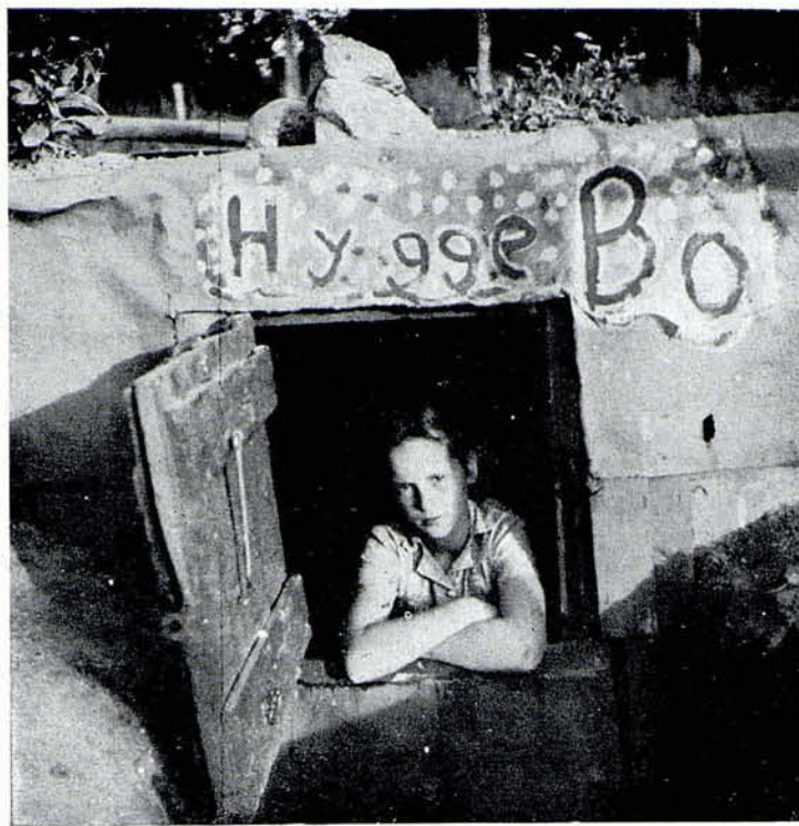
Una de las barracas construidas por los niños en el campo de Emdrup, Copenhague

No hay la menor duda de que un campo de juego como éste es más grato para los niños de una ciudad que otras clases de campos, pero se suscita naturalmente, también, cierto número de problemas sobre esta materia.