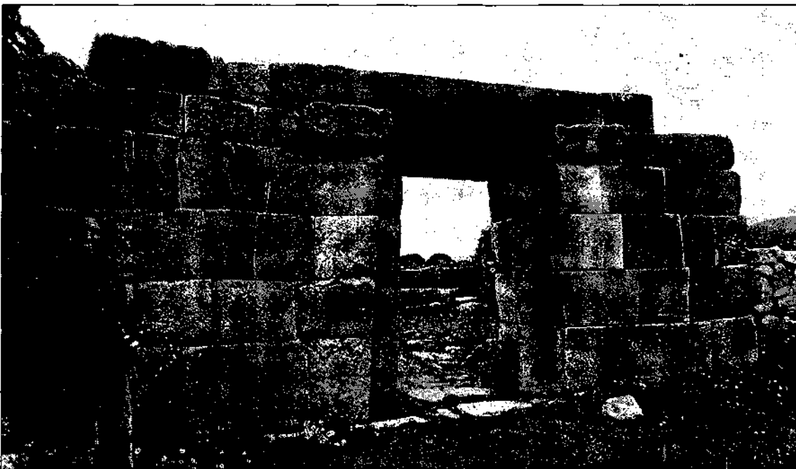
Fig. 3. Portada inca de Huanuco Pampa.

Per la seva banda, continuant la seva tradició de cooperació amb el Perú iniciada a Kotosh, l'expedició japonesa a l'Amèrica nuclear portà a