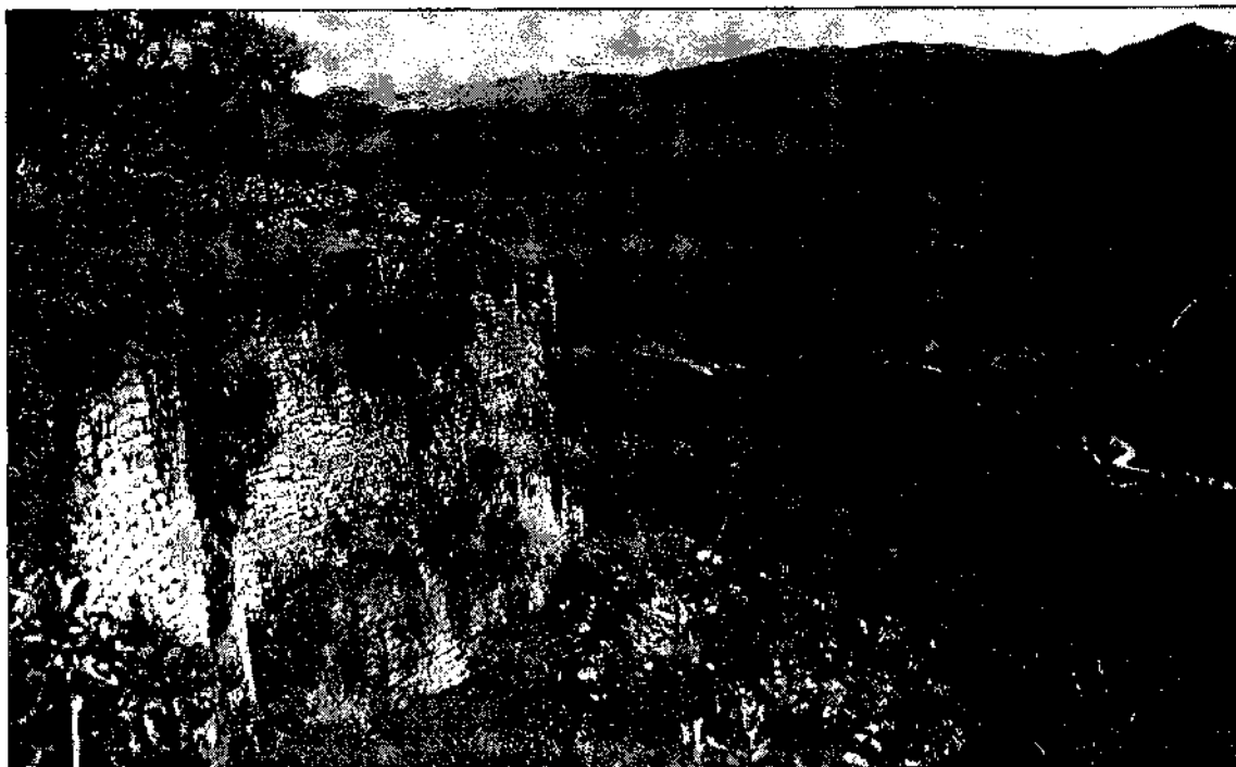
Fig. 4. Kuelap, a Chachapoyas, assentament de la serra relacionat amb la zona de selva.

Durant la dècada de 1980, a la resta del país hi ha petits projectes portats a terme per arqueòlegs peruans, generalment a les zones on existeixen universitats que formen arqueòlegs,