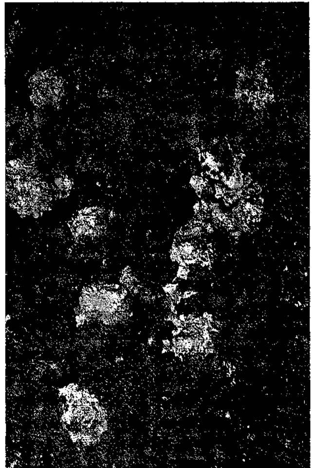
Fig. 3. Trèts efectuats sobre el panell pintat del conjunt d'Antona.

-S'ha de portar a terme de tal manera que el visitant rebi la suficient informació in situ sobre allò que és del seu interès i de tal manera que pugui entendre el motiu del tancament. Per tal d'aconseguir aquest re- sultat, és necessari recórrer a solucions com ara la instal·lació al peu de les picto- grafies i a l'interior dels tancaments d'uns plafons en els quals es reproduïxen els calcs de les pintures, acompanyats d'una succinta explicació sobre el que s'està con- templant, la significació i importància com a Bé Cultural d'Interès Nacional i Patrimoni Mundial i vulnerabilitat de les pintures. En aquesta línia de «tancaments didàctics», l'any 1998 el Servei d'Ar- queologia finalitzà el tancament del con- junt de la Vall de la Coma, a l'Albi (les Garrigues).