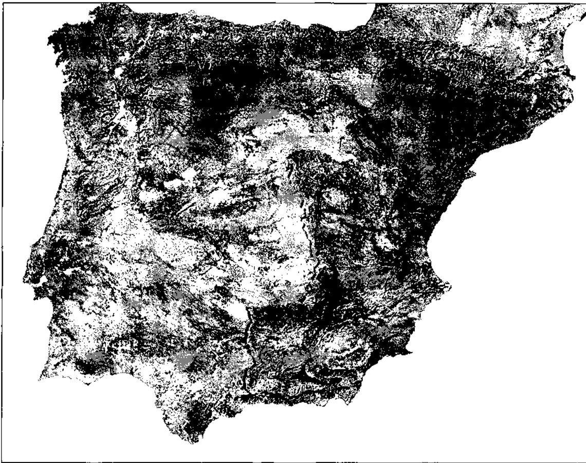
Fig. 1. Abast territorial de la declaració de Patrimoni Mundial

dels pigments amb què fou realitzada i a l'acció dels agents físics, dels processos químics o biològics presents a la naturalesa. El llarg interval de temps transcorregut des del naixement fa inevitable el deteriorament dels elements que formen el suport o la matèria.