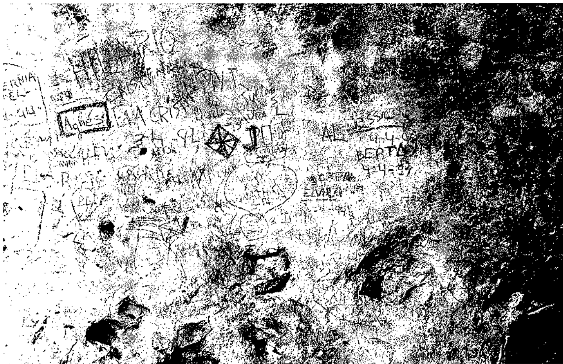
Fig. 5. Grafitis realitzats sobre el panell de l'Abric IV del conjunt d'Ermites de la Serra de la Pietat.

mentats —declarats Béns d'Interès Cultural des de 1985, Béns Culturals d'Interès Nacional des de 1993 i Patrimoni Mundial des de 1998— no ha elaborat un instrument de protecció específic per a aquests conjunts. Aquesta situació es deriva de la mateixa norma legal que imposa la necessitat.