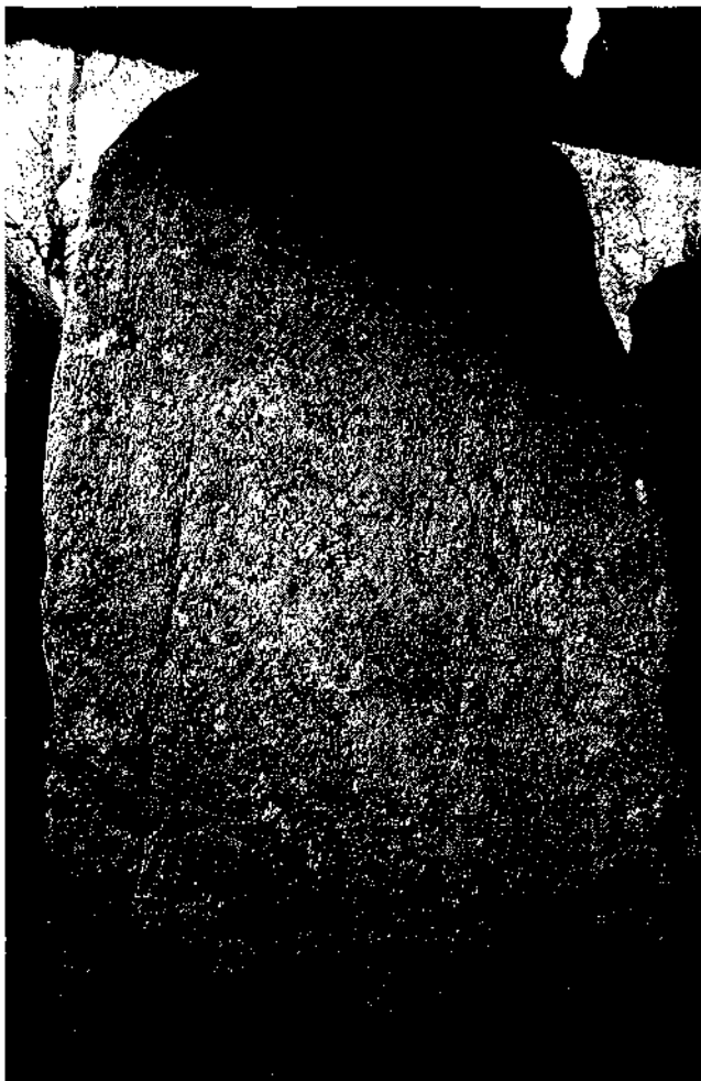
Fig. 2. Ortostat del lateral nord del sepulcre de Cova d'en Daina amb restes de pintures i gravats.

invisibilitat dels motius una vegada acabat el túmul, proposa un argument important per a la valoració de la contemporaneïtat entre arquitectura i decoració (BUENO RAMÍREZ; BALBÍN BEHRMANN, 1992, 1998). Aquest argument queda completat amb la documentació de gravats o de pintures darrere els ortostats de la cambra: Huerra de las Monjas, a Càceres (BALBÍN BEHRMANN; BUENO RAMÍREZ, 1989; BUENO RAMÍREZ, 1988), Alberite I, a Cadis (BUENO RAMÍREZ [et al.], 1999, 53), Anta Grande de Zambujeiro, a Évora (BUENO RAMÍREZ; BALBÍN BEHRMANN, 1992, fig. 58), o a la part superior dels ortostats, cas del dolmen d'Azután, a Toledo (BUENO RAMÍREZ, 1991). Novament ens trobem davant una ubicació que té comparació amb d'altres monuments megalítics europeus, com Gavrinis (LE ROUX, 1982) i que proposa la necessitat de documentar els darreres dels ortostats com a possibles receptors de decoració.