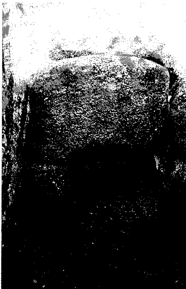
Fig. 3. Dintell de Cova d'en Daina amb gravat heliomorf.

ra, vam poder observar línies d'aspecte serpenti-forme, temes circulars i una forma trapezoïdal (BUENO RAMÍREZ; BALBÍN BEHRMANN, 1992) (Fig. 2). En aquest mateix monument, la cara visible de la primera de les llindes també presenta decoració. Ja a la fotografia que inclou Esteva (1950, Lám. III), s'observen indicis de gravats que ell no esmenta. El 1990 vam poder verificar que aquests gravats es disposen en un tema heliomorf i ocupen la mateixa situació que els gravats del sepulcre portuguès de Nora Velha (SHEE TWOHIG, 1981, fig. 58) (Fig. 3).