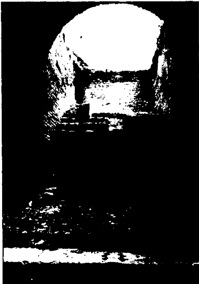
Circ romà. Escala oberta a l'extrem oriental de la façana meridional

Nombroses són les restes materials que, exponents d'aquest passat, es conserven en el subsòl i, emmascarades, en les estructures que configuren la ciutat actual. Dins del nucli urbà i per la seva importància, volem destacar el conjunt d'edificis construïts com a