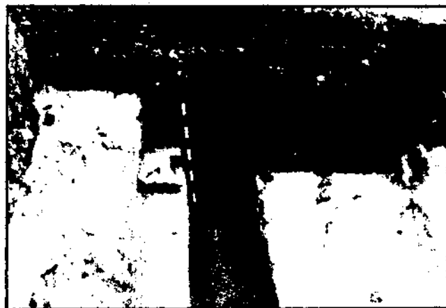
Canal de desaigua tallat a la roca

Més allunyats del nucli de l'antiga Tàrraco, fora de la Tarragona actual però dins del seu terme municipal, trobem també altres elements que contribueixen a un millor coneixement del que fou la ciutat en l'antiguitat. Les més importants són les villae , sense oblidar però les pedreres i alguns monuments funeraris aïllats com la Torre dels Escipions.