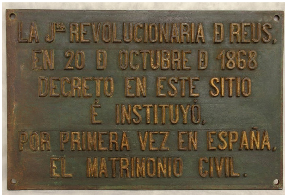
Placa commemorativa del primer matrimoni civil (Museu de Reus).

Amb la revolució de 1868, s'obrí la possibilitat de celebrar matrimonis civils, i Reus fou la primera ciutat de l'Estat que n'oferí. 29