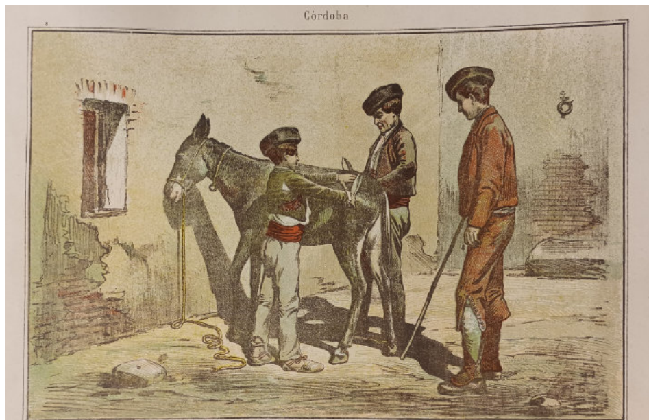
Gitanos esquiladors andalusos. Museu Romàntic Can Papiol. Vilanova i la Geltrú.