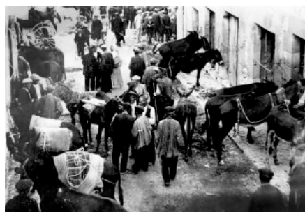
Fira de bestiar de Santa Tecla (27 de setembre), al Raval de Santa Coloma de Queralt, conegut com Raval dels gitano.