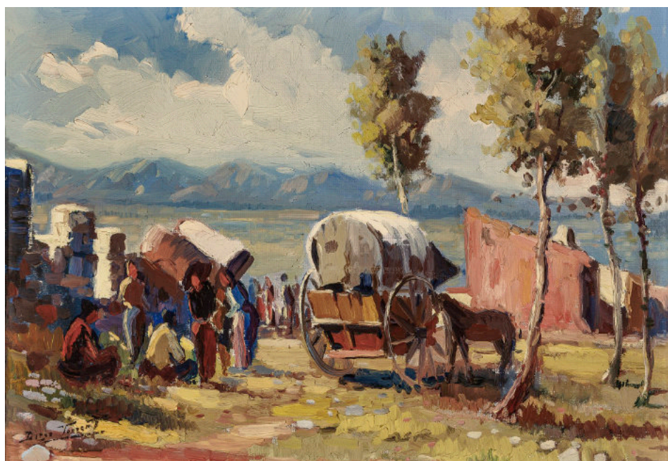
Acampada de gitanos, oli sobre tela de Diego Torrent Noguera (La Jonquera, 1926-Figueras, 2005), 31 x 45 cm. sense data. Col·lecció Museu de l'Empordà - Ajuntament de Figueras.