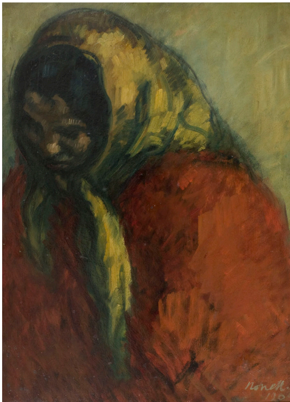
Isidre Nonell Monturiol, Gitana amb mocador al cap , 1904. Museu Nacional d'Art de Catalunya, llegat de Santiago Espona, 1958.