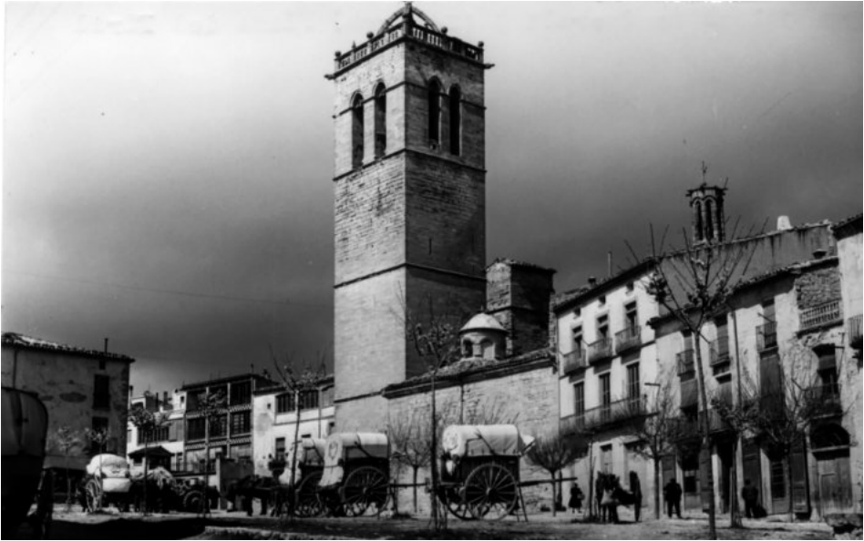
Santa Coloma de Queralt, tradicional escenari de fires de bestiar.