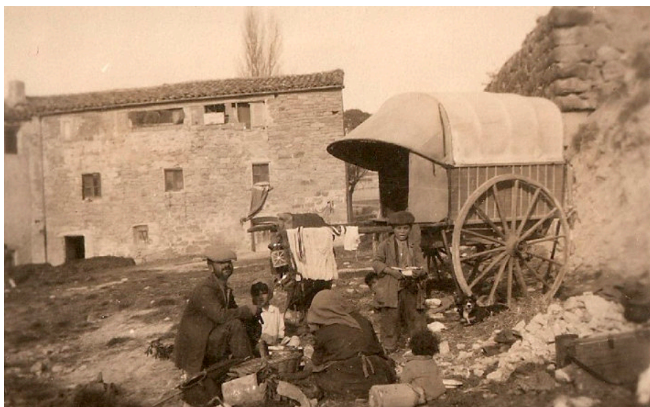
Imatge d'una família menjant al costat d'un carro amb vela.