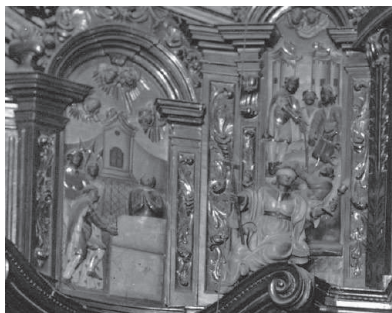
Fig. 10. Donació de corona d'or i martiri de Sant Feliu