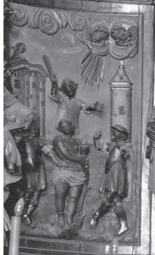
Fig. 8. Turment de Sant Feliu amb bastons