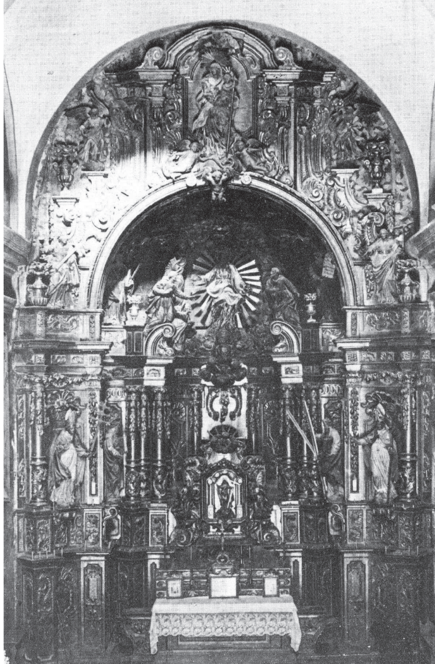
Fig. 5. Juneda 1959 (Martinell 1963, lám. 69)