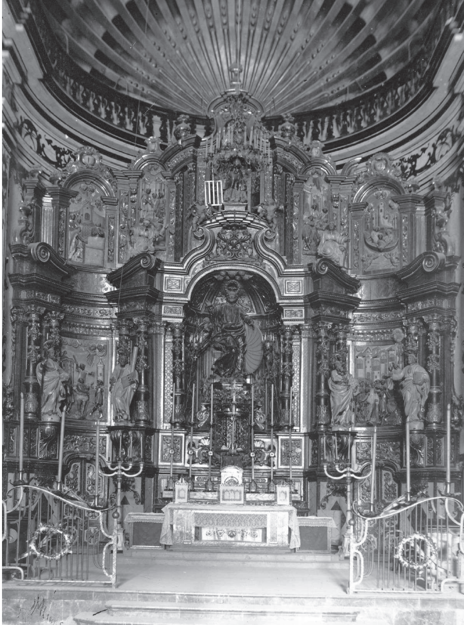
Fig. 2. Constantí 1747.