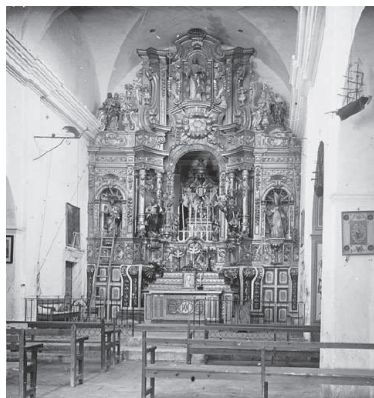
Fig. 3. Pineda 1758

Després treballa a: Riudecols (el 1753 executa el retaule del Roser), Reus (el 1753 fa el retaule major del convent carmelita de la Puríssima Concepció i 1769 acaba el retaule de santa Susanna per a l'església prioral de Sant Pere), Monroig del Camp (el 1754 fa el retaule de sant Antoni de Pàdua), La Pobla de Montornès (el 1755 confecciona el retaule del Roser per a la parroquial), El Vendrell (entre 1755-1758 realitza dos retaules, el de sant Sebastià i el dels Dolors), Poboleda (el 1758 fabrica dos retaules, el de sant Nicolau i el de sant Roc, el 1761 fabrica el de la confraria del Carme, i el 1761 fa el retaule del sant Crist), La Pineda al municipi de Vila-seca (entre 1758-1766 executa el retaule de l'ermita -figs. 3 i 4-), Riudecanyes (es documenta els anys 1762 i 1770 vinculat amb la realització del retaule del Roser per a la parroquial) i Alforja (el 1767 també fa un retaule del Roser). A partir de