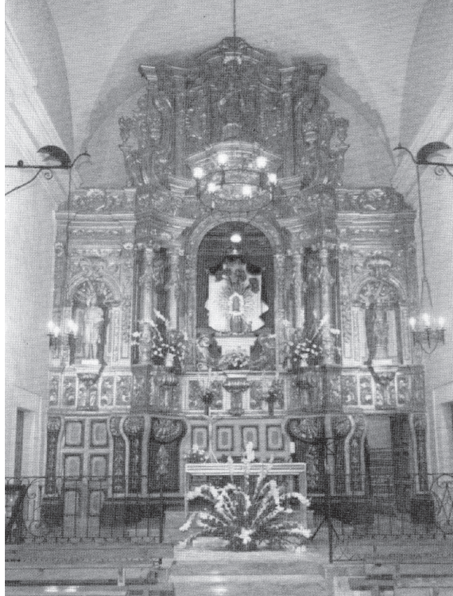
Fig. 4. Pineda 1758

així com el retaule major del convent de Sant Domènec a Tarragona, realment és una obra contractada el 1743 per Lluís Bonifàs i Sastre, juntament amb el seu fill Baltasar.