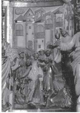
Fig. 7. Predicació Sant Feliu a Girona