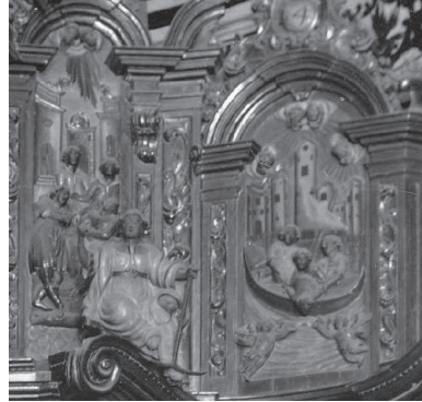
Fig. 9. Sanament de Sant Feliu i llançament al mar