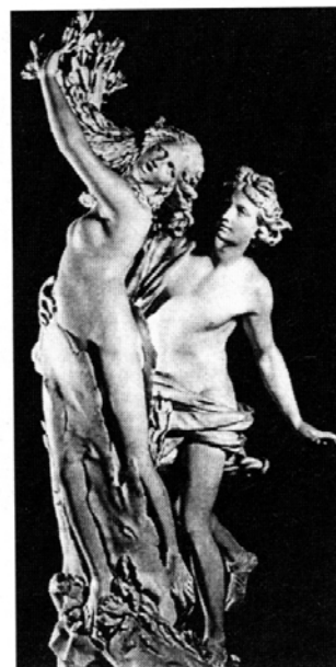
Dafne i Apol·lo segons una escultura de Gian Lorenzo Bernini

Els antics suposaven que l'olor aromàtic penetrant del llorer comunicava el do de la profecia i l'entusiasme frenètic, i d'aquí el costum de coronar els poetes i dedicar corones