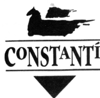
Escuts municipals que es troben representats al nostre municipi