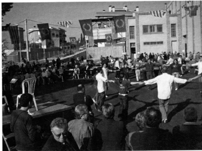
Cooperativa Agrícola de Sant Isidre. Celebració del cinquantenari