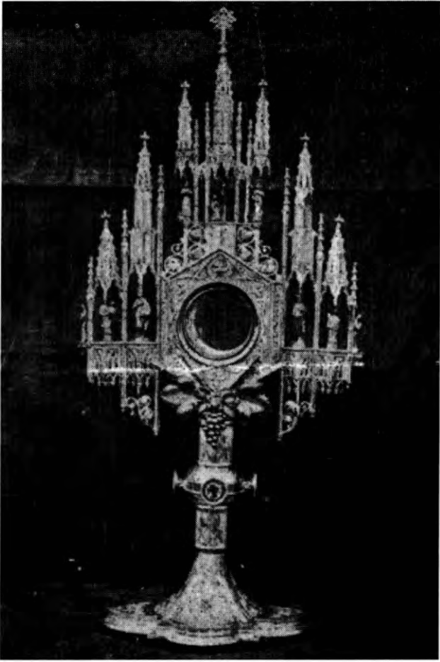
La Custòdia de la Parròquia (1918)