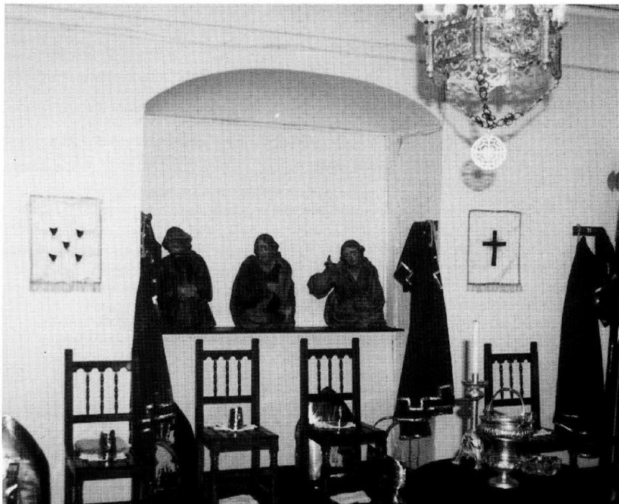
Al centre de la fotografia, les tres peces escultòriques que va tornar el Museu de Reus l'any 1940, actualment exposades al petit museu parroquial de Constantí.