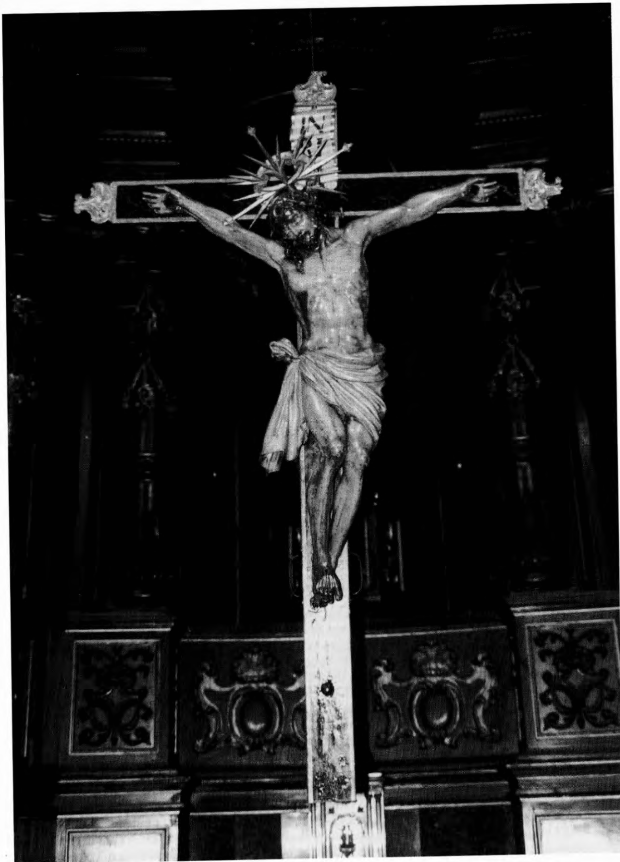
L'anomenat "Sant Crist Petit" (o "dels Segadors"), salvat l'any 1936.