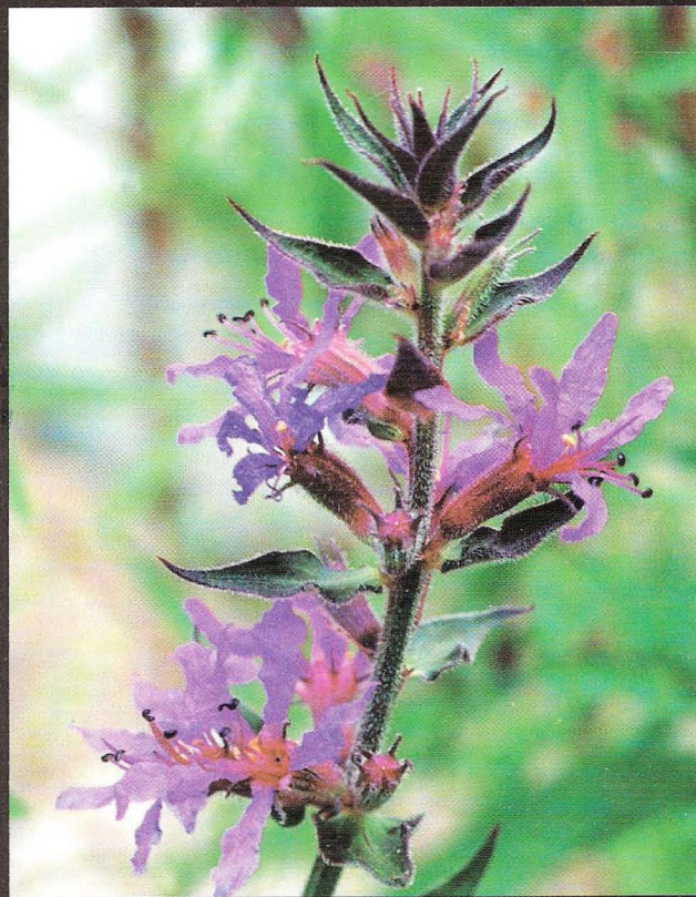
DETALL DE LA FLOR