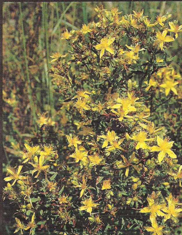
DETALL DE LA FLOR