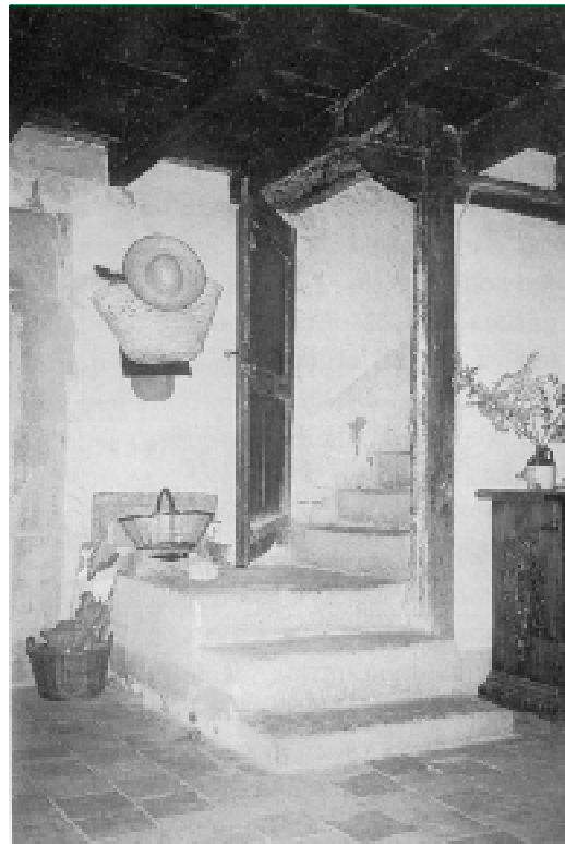
Interior de Cal Cabrer, el carrer de Sorerols cantonada al carrer de Baix.

Com és natural, les cases del poble de Tavertet estaven construïdes amb pedra calcària del mateix país i, generalment, amb les obertures amb brancals i empits de pedra picada, també tallada al mateix terrenal. Una bona part tenen la data esculpida a la llinda i algunes també una creu, algun dibuix i el nom de qui les va fer construir, o sigui, del primer propietari. La Coromina i la Rectoria mostren el portal noblement adovellat;