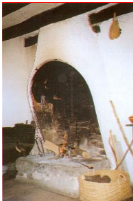
La llar de foc de Cal Cabrer, un estil present a moltes cases de Tavertet

també podien ser per a criar-hi bestiar. Al fons de l'entrada unes portes donaven a les estances que servien de corts i per endreçar-hi la llenya; també hi havia l'accés al femer i a l'hort. L'escala, tota de pedra, portava a