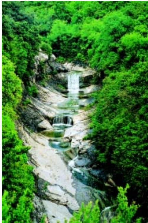
El torrent de Gorgàs, aquí anomenat riera de Molí-bernat, passat el pont del mateix nom.

seguit amb el torrent de la Cau i, seguidament, amb el quintà de Novelles a banda i banda.