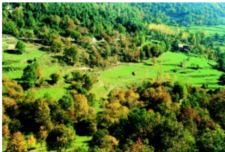
Torrent del Gorgàs o riera de Balà amagat per la vegetació, amb els prats i la masia de Novelles.

En aquest indret acaba la fondalada del Gorgàs i aquí el torrent continua amb la boga de Novelles a la seva dreta i la costa dels Castanyers a l'esquerra, per trobar-se tot