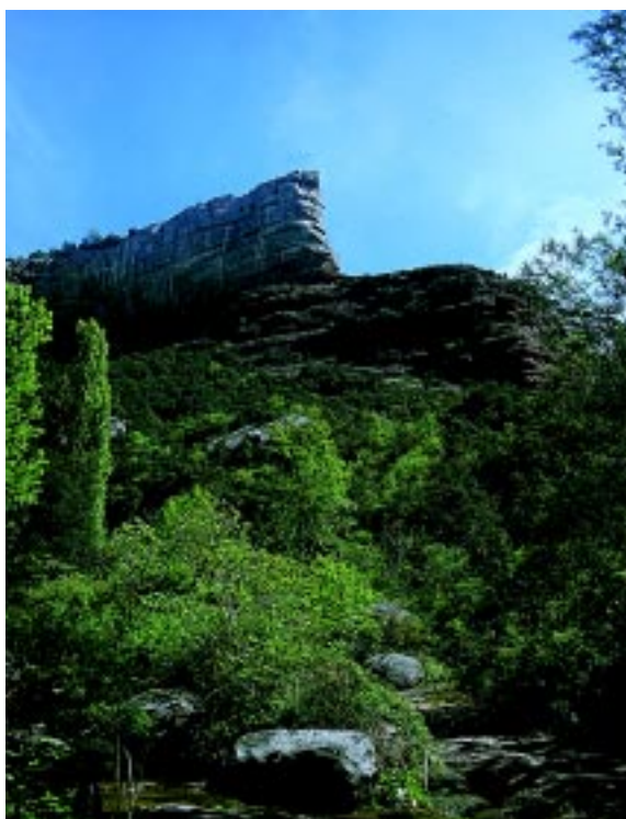
La riera de Balà al seu pas per sota del morro de l'Abella.

Com ja hem dit, amb el salt de Molí-bernat la riera canvia de nom i passa a dir-se de Balà, ja que aquí comença el sot o fondalada de Balà. La riera té un bon començament amb la magnífica i espectacular balma de les Corts, situada darrere el salt. En dies de pluges, quan la riera baixa forta, la majestuosa