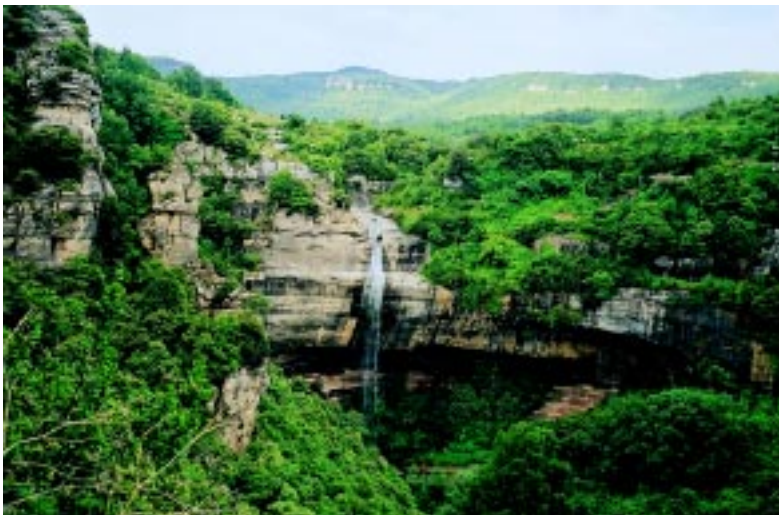
Lloc del salt de Molí-bernat i la balma de les Corts, a partir d'on la riera pren el nom de Balà fins al pantà de Sau.

El torrent de la Cau es forma als verals de la muntanya del mateix nom i de la font de l'Arrel i fa el seu curs entre faigs, roures, avellaners, brucs i boixos; a la costa de Novelles també hi abunden les alzines. En dies