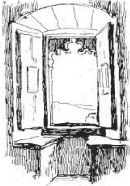
Finestra de la sala de l'Avenc. Estudi de la Masia Catalana Centre Excursionista de Catalunya

2001. És el quart volum dins la col·lecció d'Atles dels comtats de la Catalunya carolíngia, publicats per Rafael Dalmau, editor, el primer dels quals sortí l'any 1998.