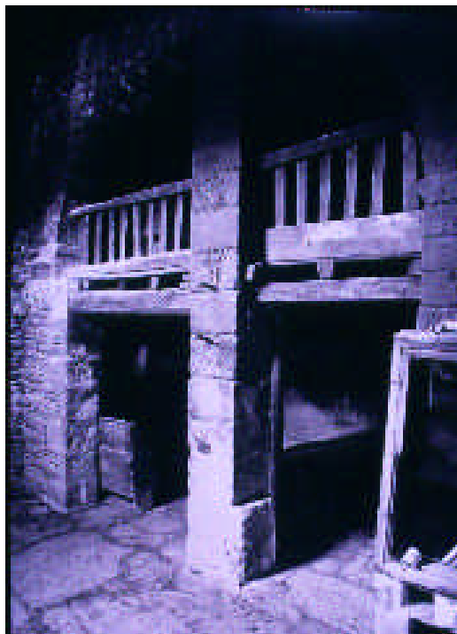
La cuina de l'Avenc, del segle XV, tal com estava l'any 1975.