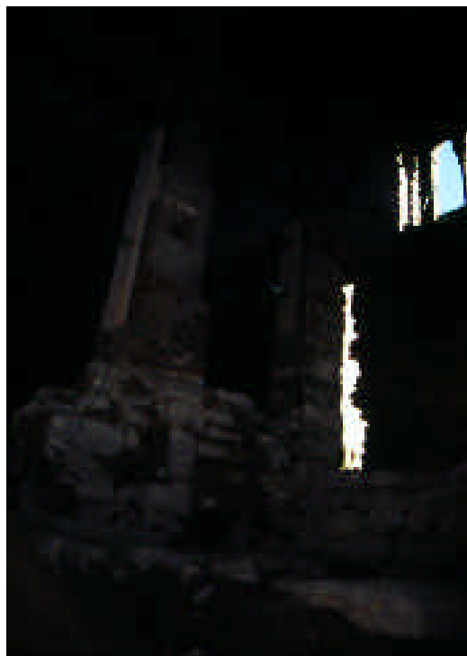
La cuina en el procés de restauració a l'any 2000. Es descobreix que el pilar està assentat sobre una construcció més antiga, probablement del segle XI.