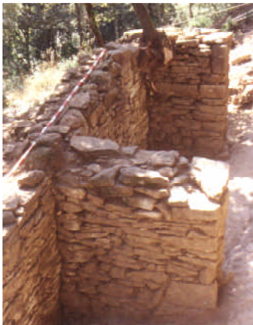
Les estances A i B, la part habitable de la casa de Sa Palomera

És de notar la rassa que tot i aprofitar part del terreny natural s'amplià i es definí segons els interessos de cada moment. En un