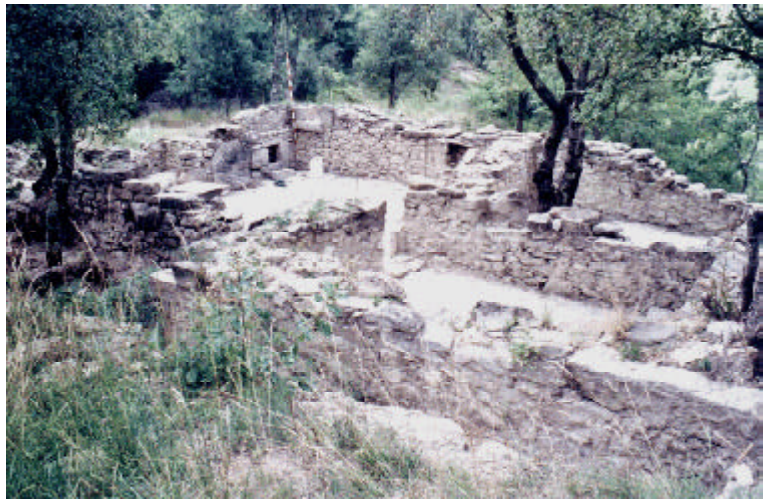
Vista general del jaciment del mas dels Turons excavat als anys 1998 i 1999

Els sectors A i B són els que presenten una major unitat constructiva tot i que hi queden de manifest les modificacions posteriors. La superfície del sector A és de 3 x 3 metres i el sector B de 2,90 x 3 metres. Conserven les parets amb una alçada d'un metre en les parts est, nord i sud, parets que tenen una amplada d'entre 60 cm (les parets del rectangle sencer) i 50 cm (la que divideix els dos sectors). Aquesta última paret sembla posterior o bé ser refeta en una etapa posterior. Tot i que es pot considerar que en general la paret es fa amb doble cara, les dimensions de les pedres que la conformen gairebé ocupen la meitat de la paret, a part d'aquelles que l'ocupen tota i que s'utilitzen per lligar-la. Es pot considerar que busquen fer filades i la paret és una paret seca. A la de nord-est destaca, a la cantonada, tota una zona de pedra cremada. Un tros estava tapat per una llosa, ja que aquí arriba la roca natural on es recolza el mas. Per tant, cal