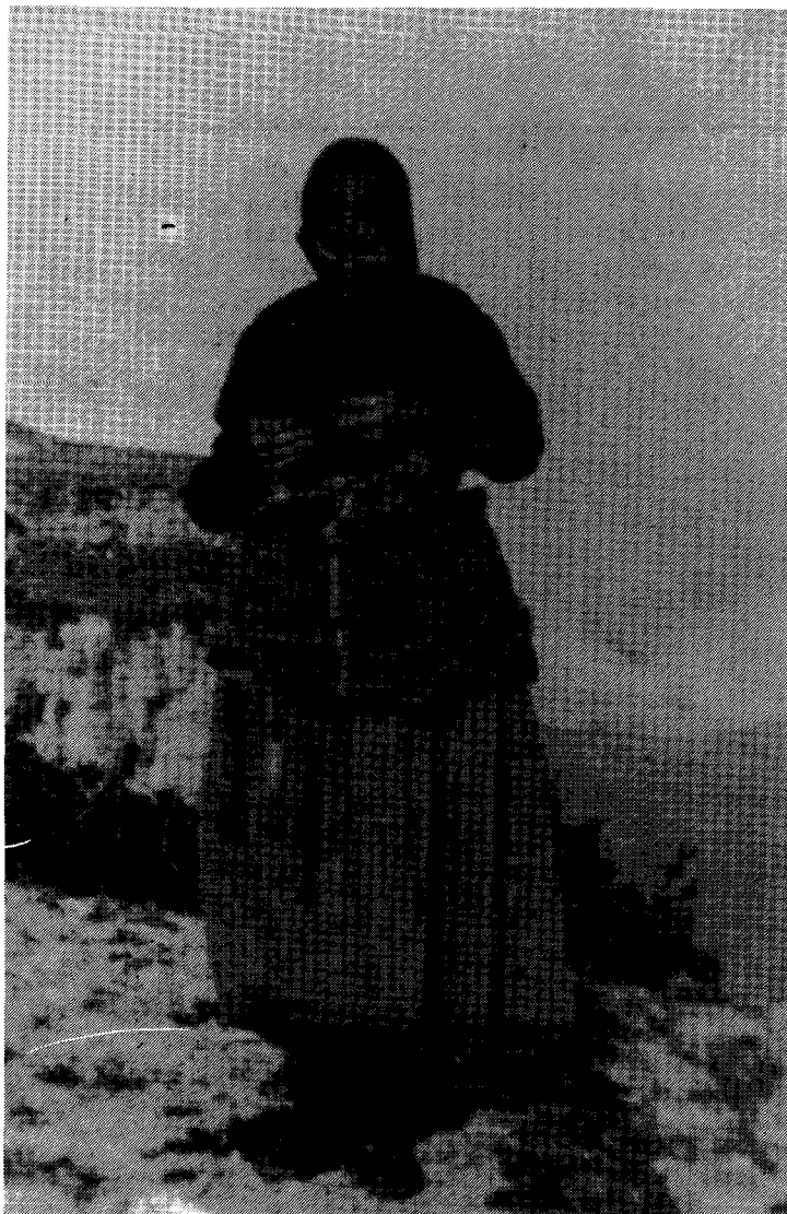
La Carme Font «La Carme Pastora» filant