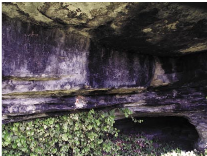
La Baumallera, que del sostre en feien l'era.

Continuant la recerca de racons perduts del terme de Tavertet presentem aquí cinc noves balmes, que ens parlen de les formes de vida dels antics habitants d'aquestes contrades. Totes cinc tenen un accés complicat, però són molt interessants i la seva descoberta és força gratificadora.