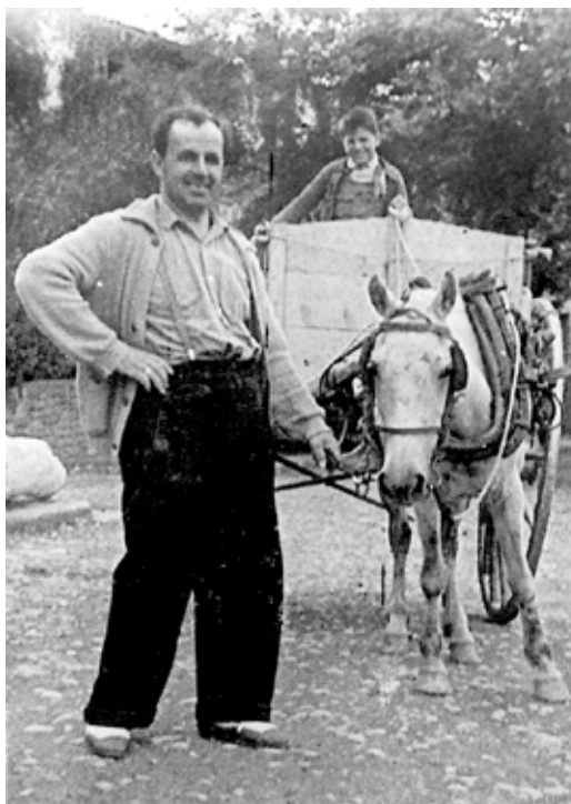
El Pagès fent el transport de la llet de Tavertet a Cantonigròs. Anys quaranta

Feia més d'un any que el poble no tenia barber i precisament el que hi havia hagut vivia a la mateixa casa. La gent del poble el trobava a faltar i van començar a dir-li que fes de barber i de cisteller com feia el que havia marxat. El nostre xicot deia que no s'hi atrevia i que no havia afaitat mai ningú. Tenia les eines de l'altre barber i, com que insistien, va pensar que ho podria intentar. El primer que s'hi va presentar era un pastor ja molt gran, va provar-ho i encara se'n va sortir força bé, no li va fer mal i el bon home va estar molt content. Al cap de pocs dies li van portar dos nens d'uns deu anys per esquilat i així la barberia es va posar en marxa. També va voler provar de fer cistells i com que el cisteller havia estat a la seva masia a fer cistelles i coves i ell era molt observador, s'hi havia fixat força, i en intentar fer-ne li van sortir prou bé. Ja el tenim comprant vímet i canyes i de dret a la feina, a fer coves i cistells. Així com l'altre cisteller sempre anava curt de material, a ell sempre li'n sobrava, potser perquè no els feia tan bé o perquè treballava més hores. En part, però, no estava gaire satisfet de l'ofici, i per altra banda veia que si estava un moment parat i les mans no treballaven, el negoci no funcionava.