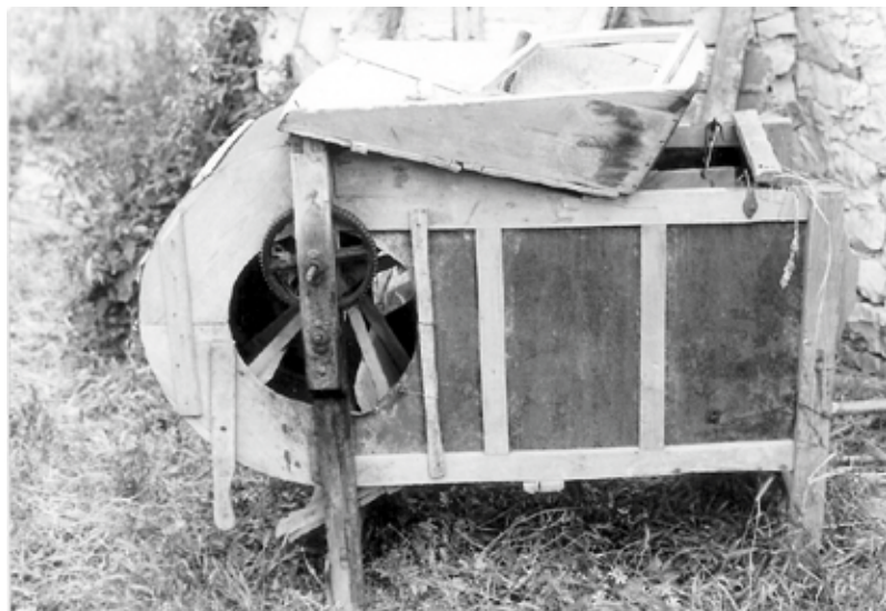
Màquina ventera, a les Baumes. Anys cinquanta.

nova i petita empresa i així va ser. El negoci era molt minso però li quedava molt temps per treballar la terra i fer altres coses. Va anar ampliant la botiga amb sabates i tota mena de calçat, i a la vegada, despatxava el pa de racionament.