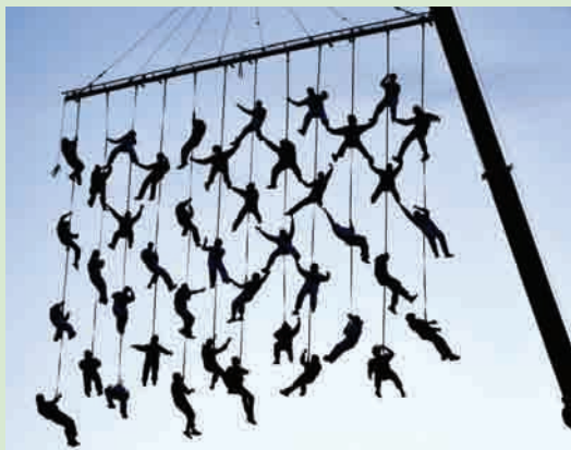
Membres d'Anigami penjant d'una grua

El dia 5 de maig, Anigami va obrir les portes de Les Comes per oferir una "gran festa gratuïta". La commemoració del 20è aniversari es va encetar amb un espectacle de La Fura dels Baus. Va ser una escenificació de la Red humana, amb unes quaranta persones penjades d'una grua, aquella gent més important que ha passat per Anigami.