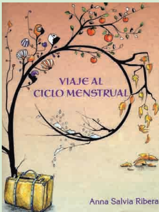
Portada del llibre d'Anna Salvia "Viaje al Ciclo Menstrual"

Aplec Independentista al camp Vatuia l'Olla de Cantonigròs