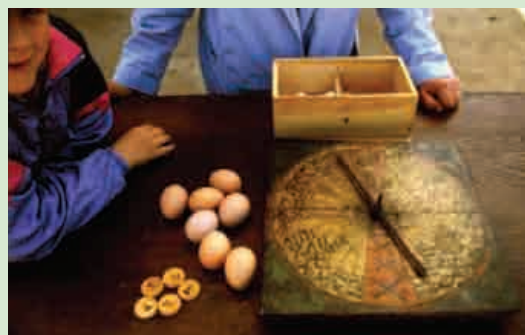
Rifa d'ous

llegendari important. El diumenge va ser presidit per la rifa d'ous, un acte, quasi una cerimònia, que fa molts anys (la "virolla" més antiga és del segle XVI) dinamitza la celebració pasqual de Tavertet.