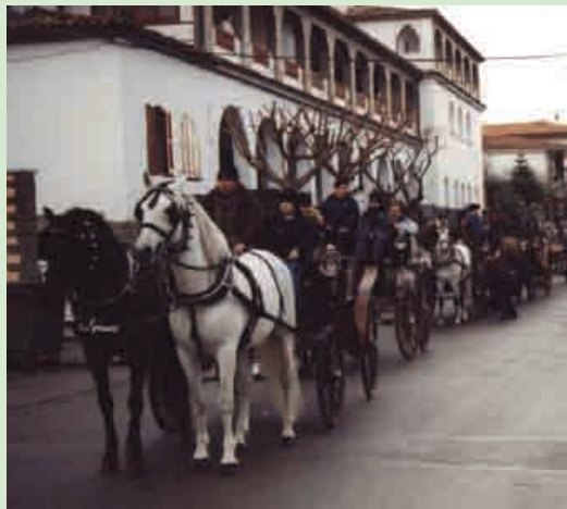
La Festa dels Tonis

El 14 de gener es va celebrar un any més la tradicional Festa dels Tonis organitzada per l'Associació Cultural per la Festa de Sant Antoni Abat de l'Esquirol. La jornada va començar amb un esmorzar pels participants a l'Hostal Collsacabra. A mig matí es van beneir els animals davant l'església i es va passar pels carrers del poble amb la música la Banda Infantil de Vic. A la tarda hi va haver un espectacle eqüestre a càrrec de Santi Sercamshows i per acabar el grup Arrels de Roda de Ter va oferir l'obra de teatre "Deixa'm el teu llit. On? Quan? Com?" a la pista de la Cooperativa.