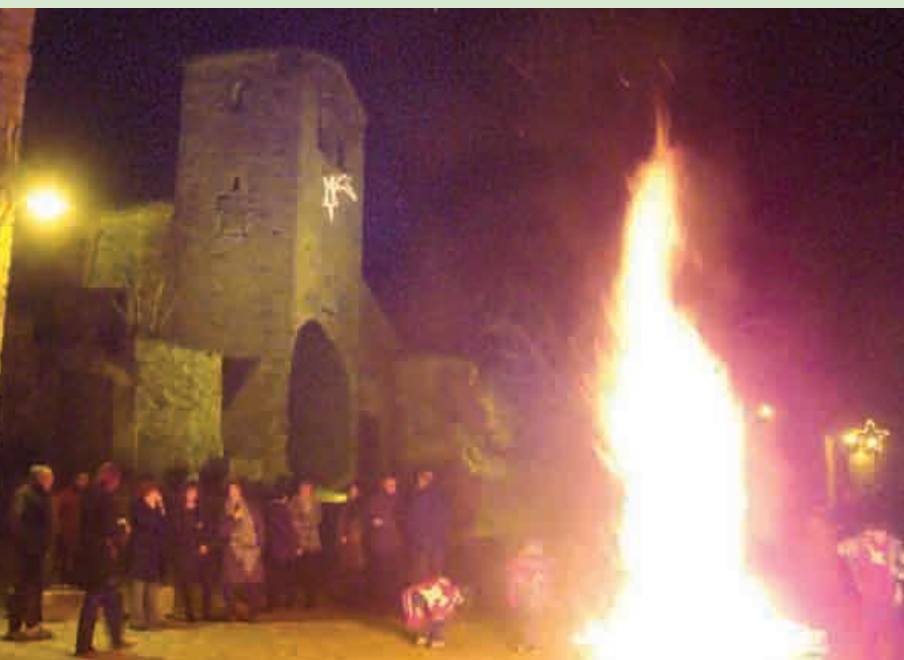
Foguera de cap d'any a Tavertet

Cap d'any.- El poble, com des de fa molts anys, s'ha reunit a la Plaça Major, per rebre les campanades de les dotze i celebrar l'entrada de l'any a l'entorn d'una foguera ben emblemàtica.