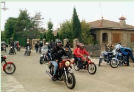
Trobada de motos de Roda, el diumenge dia 10 de juny. Els participants arrenquen en direcció a Rupit.

El dissabte 10 de juny s'organitzà la trobada anual que tutela els "Amics del Motor de Roda de Ter". Una vegada més es va poder contemplar veritables joies del passat, tant de motocicletes com d'automòbils