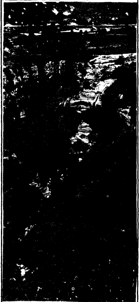
- Salt del molí Bernat

ment bonics i amb força més cabal; però cap no guanya en emoció ni en la seva rotunda i definitiva bellesa, a la "Cua de Cavall". No s'hi arriba pas fàcilment, al gorg de les Fades; però tot l'esforç és poc, si es pot contemplar i assaborir aquest fabulós i fantàstic saltant.