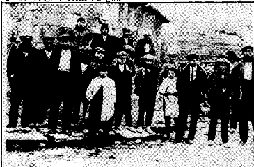
Grup de gent des del poble i excursionistes per allà els anys 21 ó 22.

Hi havia el costum de dir: "Per St. Miquel la beguda