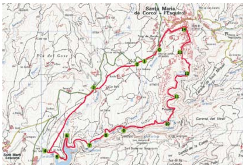
Mapa del camí ral des de l'Esquirol fins el pont de la Teuleria i la riba dreta de la riera de les Gorgues

Itinerari molt interessant, de suaus desnivells i paisatges de forts contrastes, amb dues parts molt ben diferenciades, ambdues imprescindibles per conèixer bé aquestes contrades: el camí ral de Vic a Olot i la riera de les Gorgues.