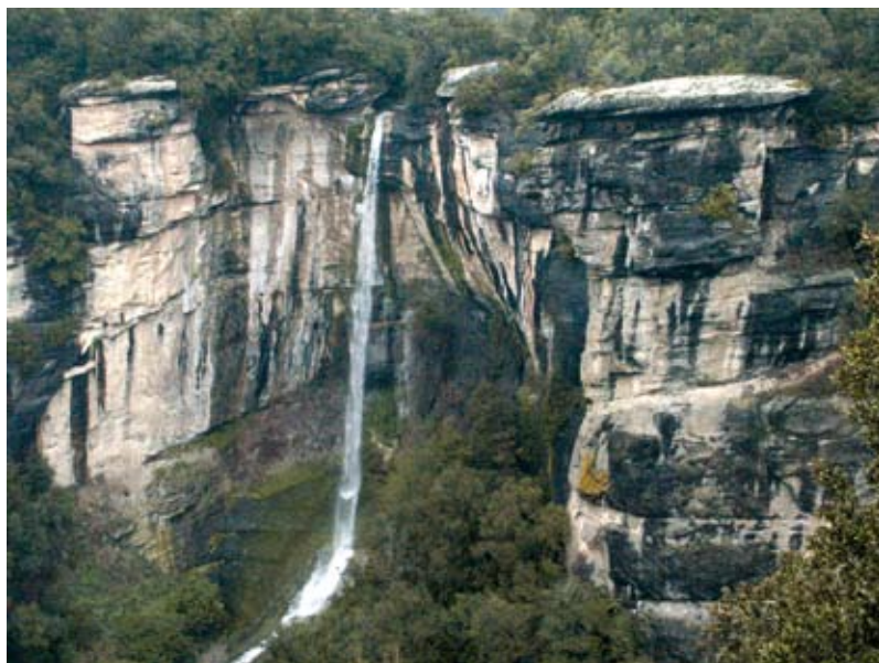
La Barra de Ferro i salt de la Barra de Ferro.

6. Salt de les Paganes (4,3 Km - 463 m). El camí gira en direcció nord, es converteix en un corriol i es fica dins un petit bosc. Vistes al salt de les Paganes. Es travessa la riera de les Paganes uns metres per sobre del sallent.