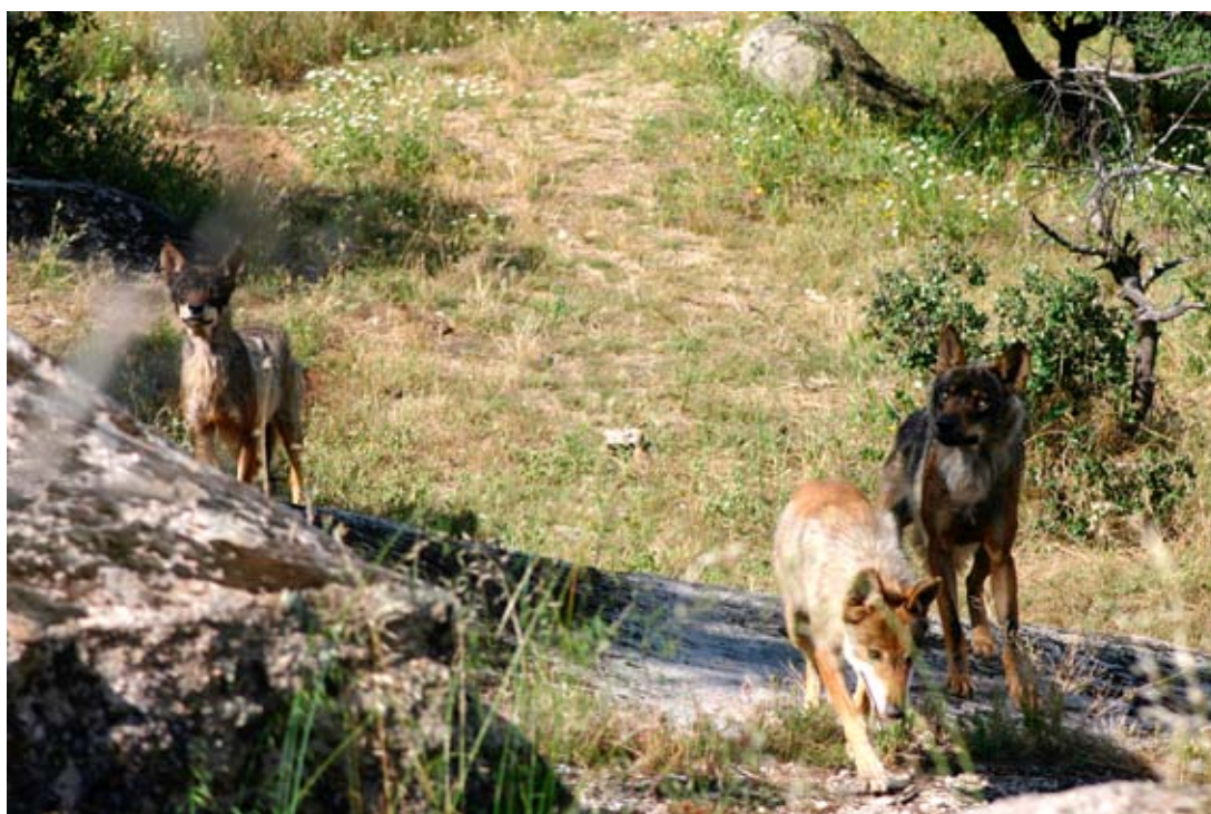
Tres llops

En entorns ramaders on hi ha la presència del llop s'han utilitzat mètodes per poder prevenir o minimitzar els atacs per part del llop als ramats. Com exemples podem citar la zona de Zamora, on s'utilitzen les "corralas", uns recintes on es tanquen els ramats durant la nit, els quals estan suficientment condicionats per prevenir l'atac dels llops.