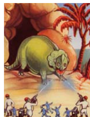
Lluita amb monstres de Mart