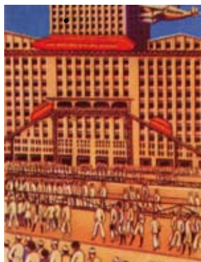
Catifes mòbils i funiculars