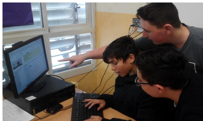
Figura 2. Alumnes en el procés de decidir canvis en la dieta d'un dels avatars.

gustos culinaris dels avatars, sempre en relació al seu pressupost global.