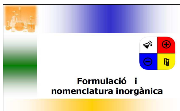
Figura 1. Portada de la presentació

Seguint la proposta realitzada pel Seminari de Química "Del Batxillerat a la Universitat", pels compostos binaris i els hidròxids s'utilitza la nomenclatura de composició o estequiomètrica amb les seves tres variants: amb prefixos multiplicadors, amb nombres d'oxidació i amb nombres de càrrega per als compostos iònics. Pel que fa als oxoàcids, oxosals i sals àcides s'ha optat per l'ús de la nomenclatura tradicional, acceptada per la IUPAC.