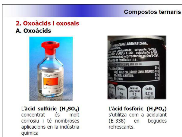
Figura 2. Exemple de diapositiva de la presentació

La presentació, a més de facilitar un resum de les darreres recomanacions de la IUPAC, aporta un