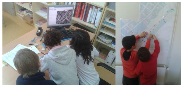
Figures 4 i 5. Gràcies al projecte, fem que Campredó sigui a Google Maps i muntem el mapa de zones verdes.

Què podem fer amb tota aquesta informació que tenim ara per millorar el nostre poble? Aquesta pregunta, plantejada als alumnes, va ser contestada en poc més de cinc minuts: fer un mapa de perillositat.