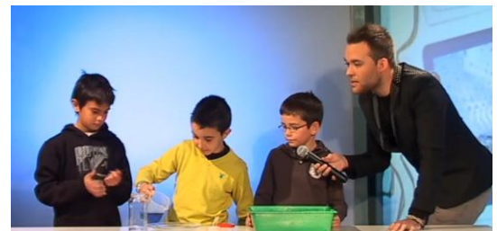
Figura 8. En directe al plató de Canal TE.

Si voleu saber més sobre aquest projecte, podeu consultar l'ARC : http://apliense.xtec.cat/arc/node/30053 . Aquí es pot descarregar tot el material i guies que expliquen amb tot tipus de detalls per a que qualsevol mestre ho pugui dur a terme amb els seus alumnes.