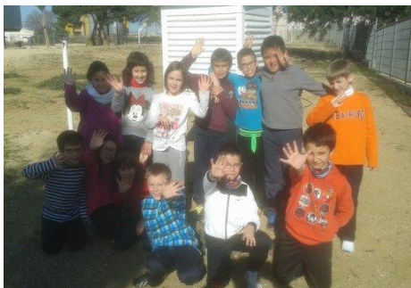
Figura 1. Els protagonistes: l'alumnat de cicle mitjà.