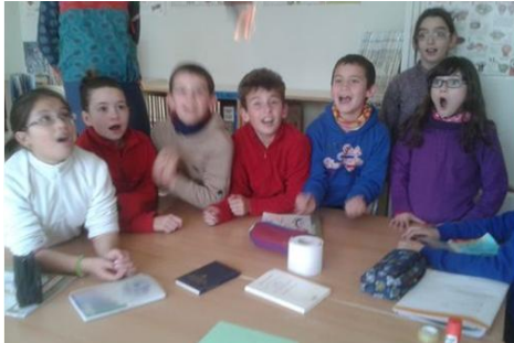
Figura 6. L'aire calent puja.

Els alumnes van pensar en tres possibilitats: generar electricitat, inflar globus i refredar la biblioteca