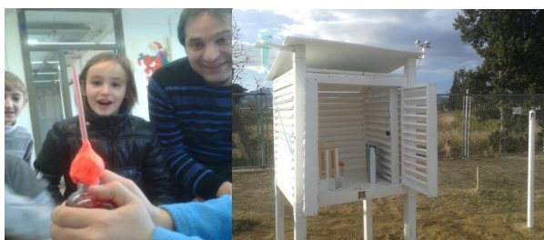
Figures 2 i 3. Experimentant amb la dilatació i l'estació meteorològica.

Amb motiu del dia mundial de la ciència, l'Observatori de l'Ebre va fer un dia de portes obertes. Alguns alumnes van poder assistir i van poder observar i preguntar com és i quines característiques té una gàbia meteorològica. Una empresa de muntatge de palets ens va regalar tota la fusta que vam necessitar, i tots els nens de l'escola des de tercer fins sisè, a les hores de pati i de manera totalment voluntària, van ajudar a pintar-la. Ara ja podíem mesurar diverses variables meteorològiques: direcció i intensitat del vent, pluja, pressió atmosfèrica, temperatura i, gràcies a unes taules penjades a la classe, també podríem recollir dades sobre la humitat i la sensació tèrmica.