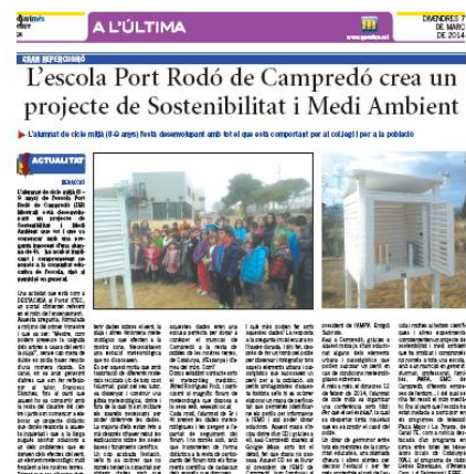
Figura 9. Vam sortir als mitjans de comunicació de tota la comarca.