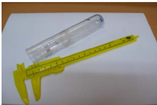
Figura 7. Calibre o peu de rei.

un resultat que ens pareix acceptable, malgrat que no tinga la precisió del mètode anterior de l'oxidació.