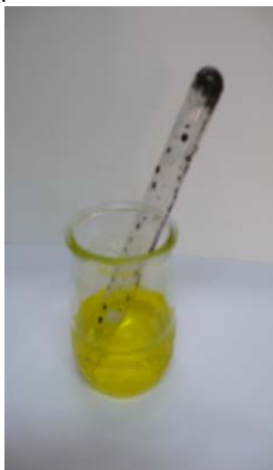
Figura 1. Muntatge experimental. Cal esperar que l'oxigen reaccione amb el ferro humit i l'aigua ascendeixca pel tub.