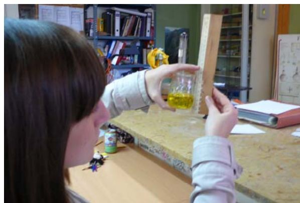
Figura 2. Alumna mesurant.