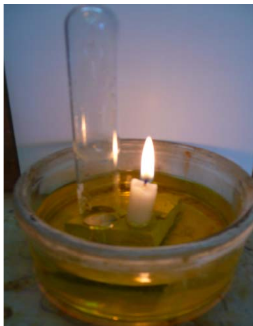
Figura 5. Observem que l'aigua no ascendeix a l'interior del tub, per estar aquest ple d'aire.

En les fotografies següents (figs.5 i 6) mostrem una variant de l'experiència que hem proposat, (Macías, 1972; Herrero Salgado, 1963).