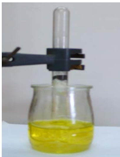
Figura 4. Sense aigua mullant-lo, el ferro no reacciona.

A la foto anterior es pot veure com la presència d'oxigen i aigua ha possibilitat la reacció d'oxidació del ferro fins a formar-se un òxid de ferro(III) hidratat de color ataronjat.