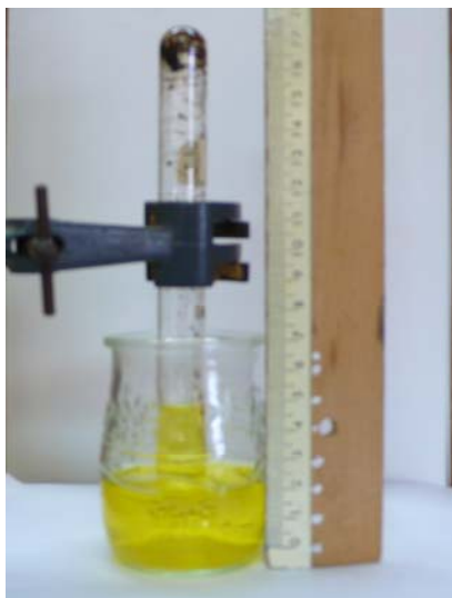
Figura 3. L'experiència, completada.

A la foto anterior es pot veure com la presència d'oxigen i aigua ha possibilitat la reacció d'oxidació del ferro fins a formar-se un òxid de ferro(III) hidratat de color ataronjat.