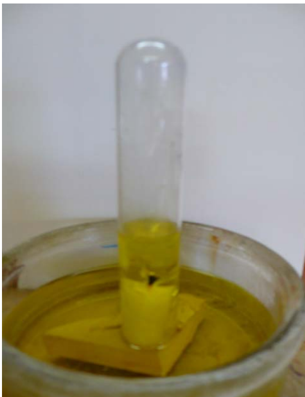
Figura 6. A l'instant de cobrir l'espelma amb el tub, aquesta s'apaga i observem com ascendeix una certa quantitat d'aigua, omplint l'espai que ocupava l'oxigen abans de consumir-se en la reacció

Té l'avantatge de ser ràpida, pràcticament instantània, i que també serveix per a demostrar el més important d'este treball: que l'aire conté oxigen, que és indispensable en les combustions, que té massa, i que ocupa un volum d'aproximadament la cinquena part del total del volum d'aire.